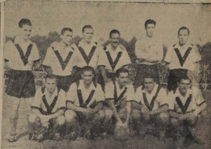
VOLVIO A GANAR.— Como en los partidos del año pasado, Santiago Morning volvió a vencer ayer a Colo Colo. Los recoletanos jugarán el match definitivo por el título con Audax Italiano, el domingo.