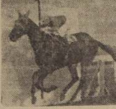
Bergerac se impone fácilmente en el Clásico Luis Aldunate sobre San Francisco, Wellington y Malayo.

Puesto el lote ante el starter no demoraron en alzarse las cintas y fue Malayo el primero en lucir sus colores en punta se guió por Bergerac, que al enfrenar la recta optó por des-