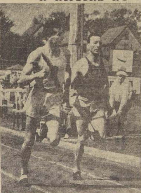
El final de una carrera extraordinaria entre los corredores estadounidenses Bill Bonthron y Glenn Cunningham. Ambos cubrieron la distancia de 1.500 metros en el tiempo "record" de 3'48" 4/5, viniendo el primero por unos sesenta centímetros.