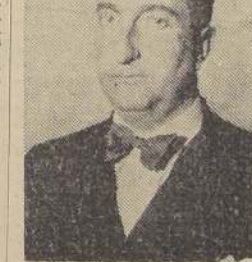
Don Osvaldo Vial, Ministro de Educación

Es necesario, es indispensable que el profesorado goce de consideración y respeto. Cuando esto se consiga, será más fácil exigirle toda la eficiencia necesaria en su gestión, que es base primordial del progreso social.