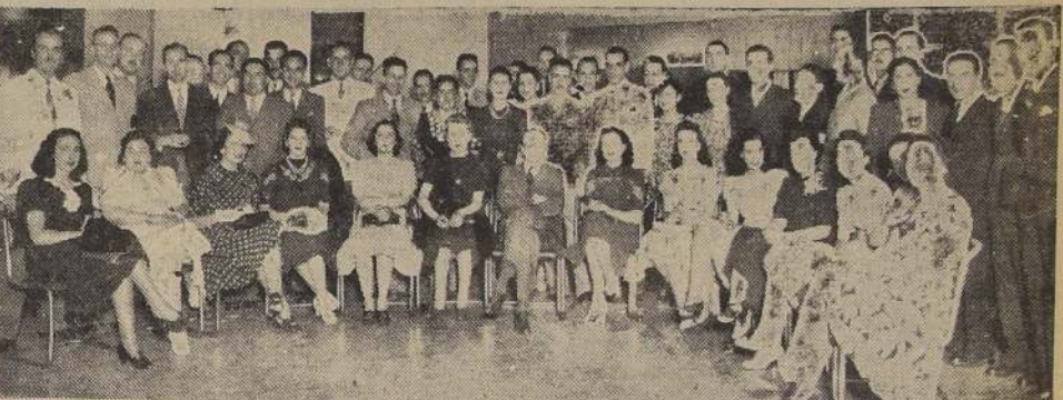
Asistentes al banquete efectuado en el "Esplanade", con que el servicio de asistencia judicial del Consejo General del Colegio de Abogados puso término a su labor anual, con motivo de haberse iniciado el feriado judicial. A esta manifestación asistieron, además, el Vicerrector de la Universidad de Chile, señor Arturo Alessandri Rodríguez, profesores de la Escuela de Leyes de las Universidades de Chile y Católica y distinguidas personalidades.

que hace un total de 285 stands que serán puestos a disposición de la industria, de la minería, de la agricultura, y de todas nuestras fuentes de producción para que concurren a demostrar nuestra capacidad económica industrial.