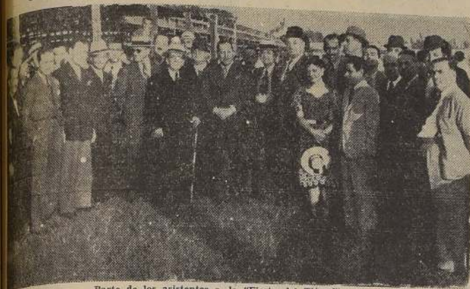
Parte de los asistentes a la "Fiesta del Tijeral"