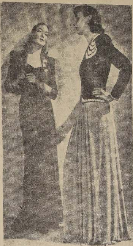
Los vestidos para la noche: Izquierda: vestido negro con tónica y bolero de lanilla azul vivo. Derecha: falda de "jersey" rosa y chaqueta de lanilla negra con lentejuelas rosa.