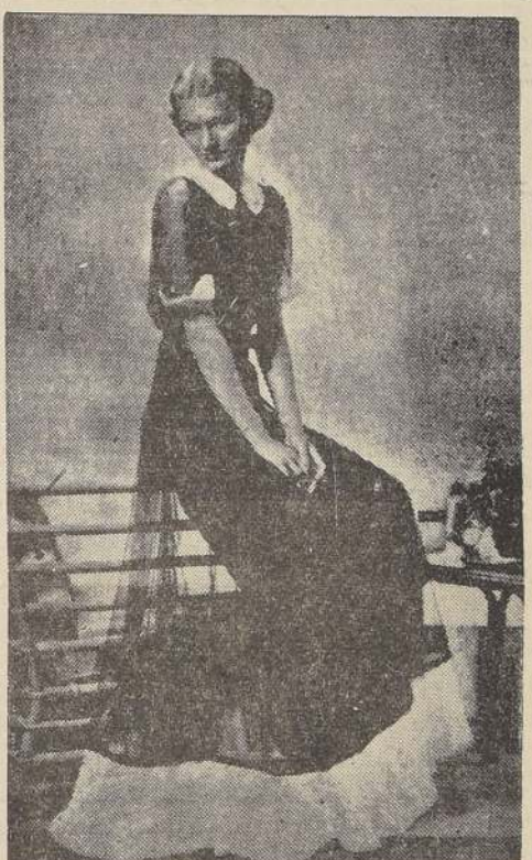
Original modelo en gasa azul marino bordeado de un ancho sesgo, cuello y puños en muselina blanca