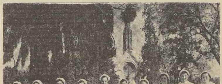
Personal de enfermeras de San Borja.—Una galería del Pensionado de este hospital.—Un moderno pabellón del Salvador.

Damos a continuación el programa elaborado por algunos establecimientos.