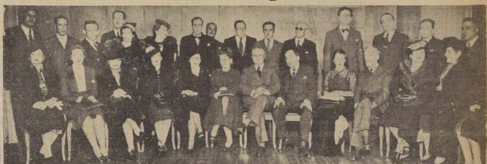
Asistentes a la comida ofrecida anoche por un grupo de intelectuales en honor del escritor argentino Manuel Ugarte.