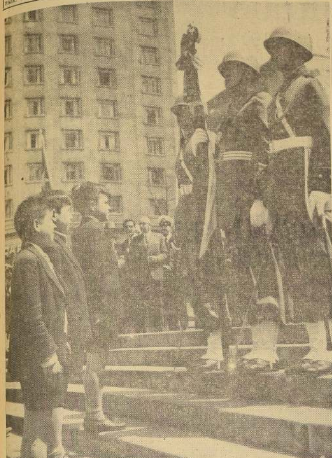
HOMENAJE A BDO. O'HIGGINS. — El Rotary Club de Santiago y delegaciones de estudiantes rindieron en la mañana de ayer un homenaje a Bernardo O'Higgins, con motivo de celebrarse el Día de la Patria y la Familia de la Semana del Niño. En esta oportunidad se depositaron hermosas ofrendas florales a los pies

TIEMPO PARA SANTIAGO: NUBOSIDAD ALTA PARCIAL TEMPERATURA DE AYER: Máxima 23 grados C., a las 18 horas. Mínima 13 grados C., a las 6 horas 30 minutos. Hoy: Máxima 23 grados C., a las 18 horas. Mínima 13 grados C., a las 6 horas 30 minutos. Se pone a las 18 horas 14 minutos. Fase: Cuarto Creciente, el 18 del presente.