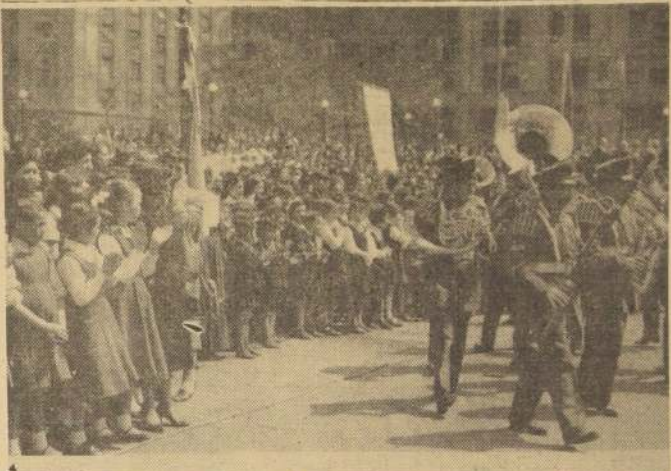
APLAUDEN A LA GUARDIA DE LA MONEDA. — En la Plaza de la Constitución se efectuó ayer un acto en homenaje a la Patria y la Familia, que forma parte del programa de la Semana del Niño, que ha

organizado el Rotary Club de Santiago. En el grabado, aparecen alumnos de escuelas fiscales y particulares aplaudiendo el paso de la Guardia del Palacio de la Moneda, que participó en esta ceremonia.