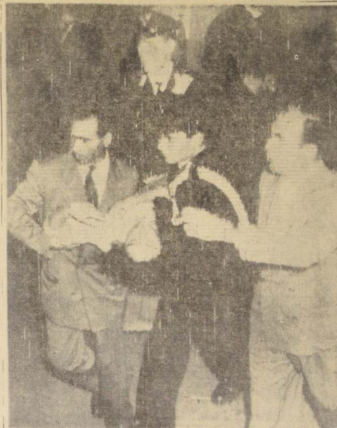
CASTEL GANDOLFO.—Policías transportan a una mujer que se desmayó en medio de la densa multitud que trataba aquí, el 9 de octubre, de ver el cadáver del Papa Pio Duodécimo. Ayer los restos de Pio XII quedaron en su sepultura definitiva.

La valiosa propiedad mil metros de terreno, con fondo a calle nueva. SANTO DOMINGO 1362 - 76 Se rematará ante 3.º Juzgado Mayor Cuantía de Santiago, el miércoles 29 de octubre, a las 16 hrs.