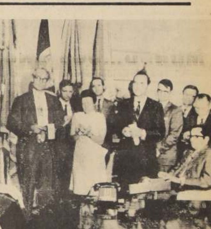
WASHINGTON (UPI).—El Presidente Nixon habla con los periodistas, comentando la economía de la nación.

En general los latinoamericanos favorecen el libre intercambio comercial como medio idóneo de colocar sus productos, en los mercados y diversificar sus exportaciones.