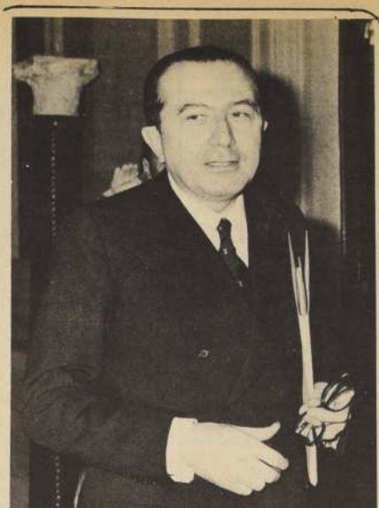
ROMA (Gentileza de ANSA).—Giulio Andreotti, el Canciller designado de Italia, sigue adelante con sus conversaciones con los partidos de Centro-Izquierda para formar nuevo Gobierno.

La fuerza pública aliada a las FAR, que se refiere a la fotografía publicada en el "Siglo Veintiuno", es censurada por la Alcaldía Distrital por haber publicado una fotografía que se refiere a la fuerza pública aliada a las FAR.