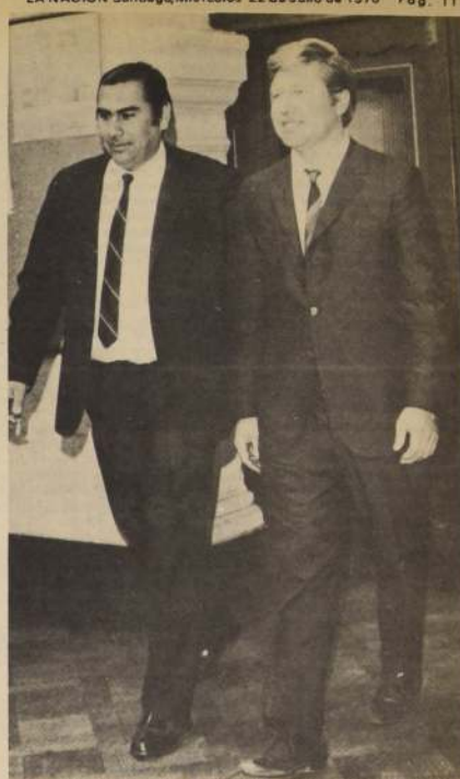
EL ALCALDE DE IQUIQUE, Jorge Soria Quiruga, junto al presidente de la Federación de Pesca Submarina. El grabado fue captado a su regreso de Europa, donde consiguieron el Campeonato Mundial de Pesca y Caza Submarina para Iquique.