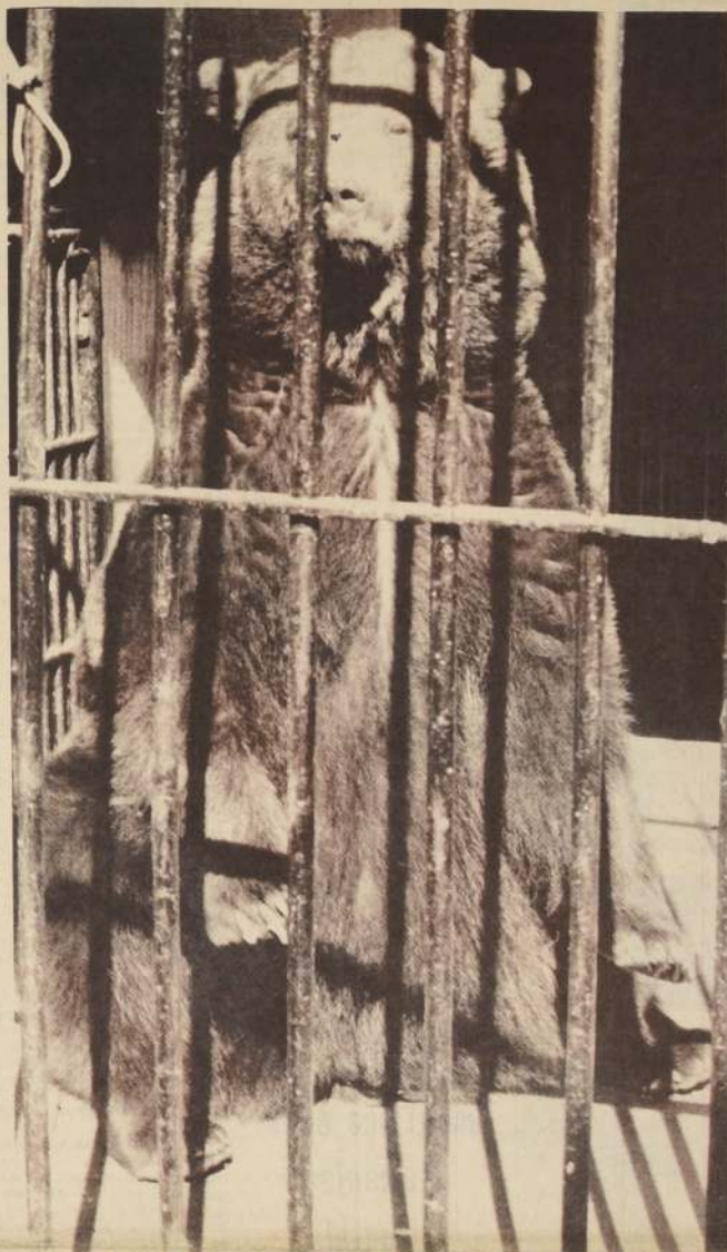
¿DONDE ESTA MI HIJO? parece decir Kazán el oso, en su jaula del Zoológico. Nadie, ni su esposa, que es la responsable de la muerte del cachorro, le responde. La muerte visitó el Zoo y dejó sólo tristeza entre los animales.

contaminación ambiental, firman ayer el Presidente Frei y el Ministro de Salud, Ramón Valdivieso.