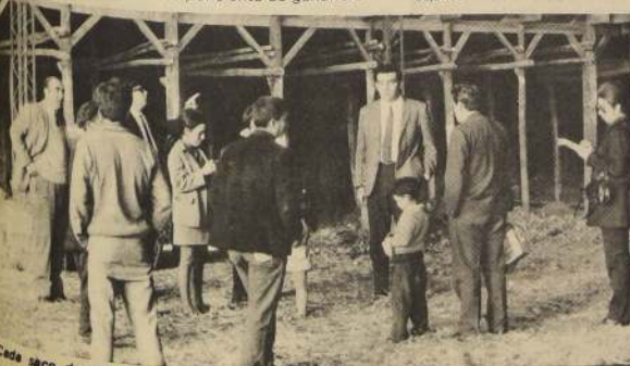
Estas papas que se compraron a 600 pesos en ECA son vendidas en la Feria, con toda tranquilidad, a 1.500 pesos. Especulación sin vergüenza, en circunstancias que el precio oficial de venta no puede subir de los 800 pesos.