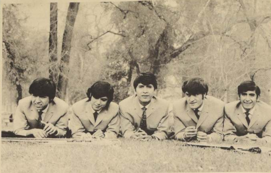
"LOS FENIX" comunican, por medio del arte, su manera de sentir la música

momentos de subir al avión realizaron una serie de "gracias" que hicieron que el resto de los pasajeros y la tripulación partieran con la sonrisa en los labios.