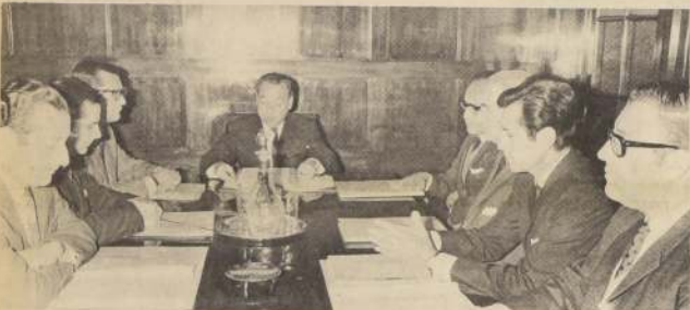
En Viña del Mar se está desarrollando la Reunión del Grupo de Trabajo de Estadísticas Portuarias, de la Asociación Regional Latinoamericana de Puertos del Pacífico (ARELAP), con participación