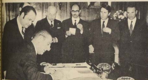
Decreto que crea una Comisión Nacional destinada a programar y coordinar una política en contra de la contaminación ambiental, firman ayer el Presidente Frei y el Ministro de Salud, Ramón Valdivieso.

contaminación ambiental, firman ayer el Presidente Frei y el Ministro de Salud, Ramón Valdivieso.