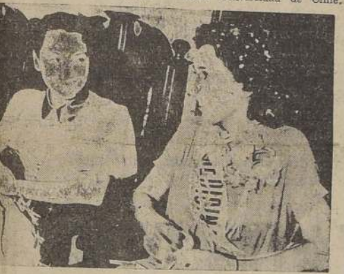
Luisa I, acompañada de la verales del año pasado.

tendá lugar en el Estadio Nacional, el que ha sido especialmente preparado para este número extraordinario del programa. Damos a continuación el programa oficial de las fiestas: Domingo 29 octubre.—19.00.—Balle Universidad de Chile.