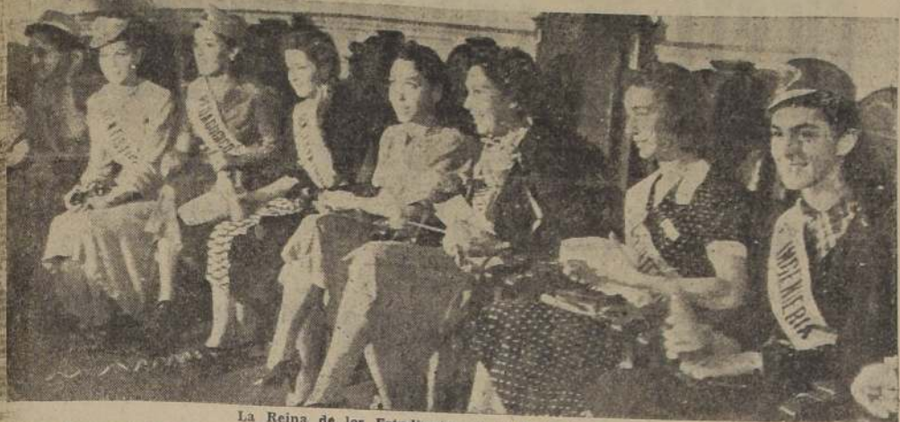
La Reina de los Estudiantes y su Corte de Honor

Entraron ayer por las calles de Santiago las clásicas Fiestas de Primavera, volando sus claras pavesas de juventud por todos los rincones de la ciudad. Las coronistas y los palardos de la granada estudiantil pusieron con la asistencia de sus notas alucinadas un paréntesis de alegría en medio de la vulgaridad de la lucha cotidiana. Los santiaguinos, cansados del negro ajedrez de una semana de