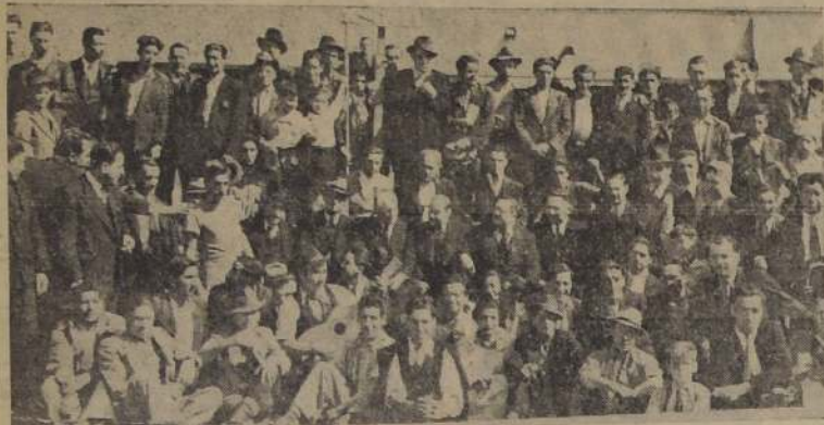
Durante las fiestas del tijeral en la Población "Bezánilla".

A las 13 horas de ayer, se llevó a efecto en la población Bezánilla de la Caja de Empleados Particulares, que se encuentra en construcción, un almuerzo dado por el contratista general don Ceiso Maggi con ocasión de colocarse los tijerales de las diversas casas de la población.