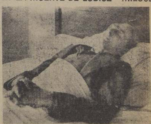
Acuerdese en sus oraciones de Oscar Vladislav de Lubicz-Milosz, nacido el 28 de mayo de 1877 en Czereia (Lituania), muerto el 2 de marzo de 1939, en Fontainebleau