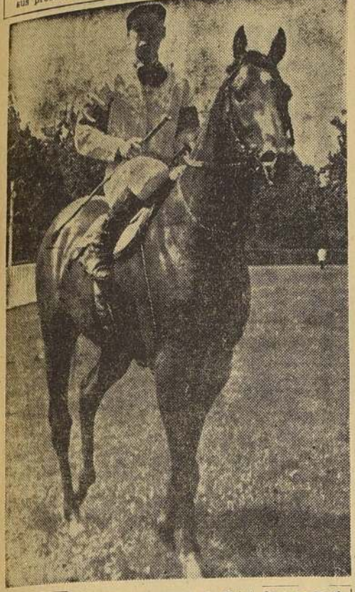
Aumentó automáticamente la chance de Saint Oregon en el próximo Derby como consecuencia del retiro de Gallardo, que no correrá por haber sufrido un grave atraso en su training.

Con el retiro de Gallardo, que se enfermó la semana pasada, ha perdido gran parte de su interés "El Derby", que se disputará el próximo domingo en el Vapurito Sporting Club. Sin embargo, la gran carrera despertará la misma emoción que en años anteriores. Damos a continuación la lista de los competidores que se inscribieron ayer, que deberán pelearse definitivamente su anotación, y hoy ratificar definitivamente su anotación, y hoy ratificar definitivamente su anotación.