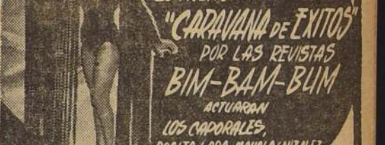
Al cumplir un año de actuaciones continuadas en el TEATRO OPERA, la CIA. DE REVISTAS BIM-BAM-BUM, estrenará hoy la revista "CARAVANA DE EXITOS", que es una selección de los mejores cuadros presentados durante el año 1953.

Acercos de ésta, la más nueva película de Humphrey Bogart, la prensa neoyorquina se ha expresado en muy elogiosos términos. El astro caracteriza a un rudo cirujano del Ejército, impregnando su papel de vida y realismo. El vigoroso drama que es "Amor en el infierno", se desarrolla en medio de intensa acción, hasta llegar a un inesperado desenlace, que impresionará profundamente al espectador.