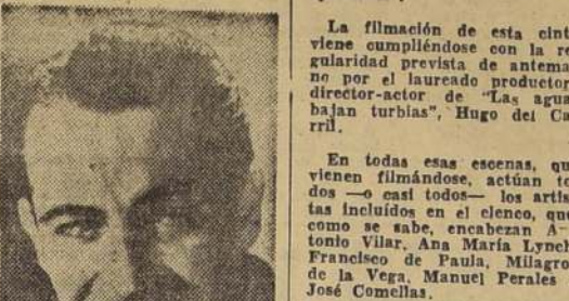
HUGO DEL CARRIL

Desde Buenos Aires nos informan que mientras se desmontan algunos decorados de interiores ya utilizados, el Director Hugo del Carril ha re-