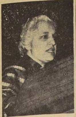
VIDYA LAKSHMI PANDIT: gesto conciliatorio.

ROMA, 11. (A. L.).— El Presidente de Italia, Luigi Einaudi, pospuso hoy las consultas tendientes a formar un nuevo Gabinete que sucede al del Primer Ministro Giuseppe Pella, por haber renunciado hace casi una semana. La decisión de Einaudi pospuso hoy las consultas tendientes a formar un nuevo Gabinete que sucede al del Primer Ministro Giuseppe Pella, por haber renunciado hace casi una semana.