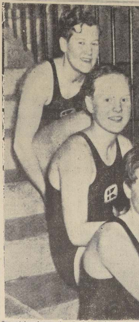
Tres nadadoras danesas: (de arriba abajo), Christensen, Brunstrom y Ragnhild Hveger. Esta última quebró ayer el record olímpico de los 400 metros estilo libre, con 5'28".

Los resultados fueron: 1.º Tetsuo Kamuro, Japón, 2'42" 5/10; 2.º Dorothy Poynton Hill, Estados Unidos, 2'51" 1/2; 3.º Nida Senff, Estados Unidos, 2'52" 1/2. En los 400 metros estilo libre, Ragnhild Hveger, Dinamarca, ganó con 5'28". Los estadounidenses clasificaron a tres nadadores para la final: Dorothy Poynton Hill, de Estados Unidos, con 5'45"; y Nida Senff, de Estados Unidos, con 5'46".