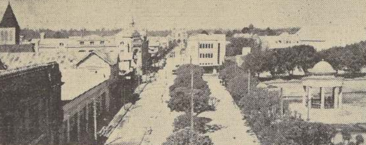
Una de las calles principales de Osorno y la Plaza de Armas

En La Picada se cuenta con un magnífico refugio, con capacidad para albergar a cincuenta personas.—(Viveros, corresponsal).