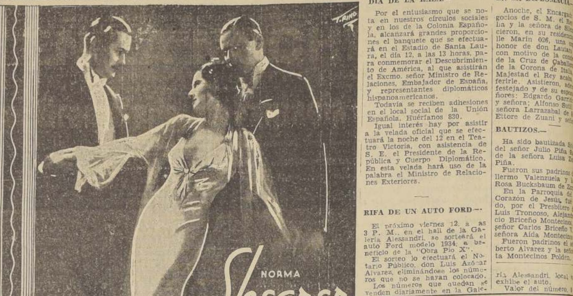
NORMA SHEARER ROBERT MONTGOMERY DESLICES

Domingo 28, Corros y Circo Universitario.