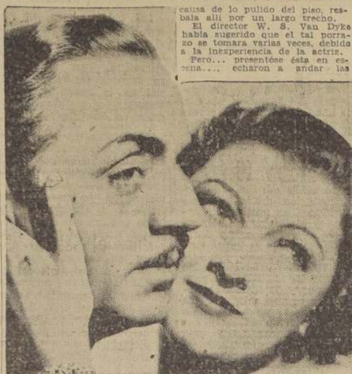
Myrna Loy y William Powell, en "La Cena de los Acusados"

La exótica belleza de Myrna Loy y la apasionada actuación de William Powell, forman la pareja ideal de intérpretes para esta