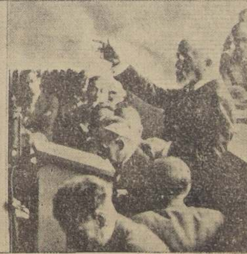
Barthou, el hombre que no se cansó de luchar por la paz de Europa y del mundo entero, aparece en estas tres fotografías, mientras pronunciaba uno de sus más ardientes discursos en la Conferencia del Desarme.

En cuanto a Sudeslavia, a su antigua tiranía fronteriza con Italia, viene a agregarse la enconada de sus rivalidades intestinas, especialmente de croatas y eslovenos, contra el poder dominante de los serbios y de la dictadura de Belgrado. Disuelto el Parlamento, el Rey gobernaba virtualmente "manu militare". La situación económica, por otra parte, ha sido no menos ingrata para Sudeslavia, que para otros países del mundo en los últimos años. Grandes