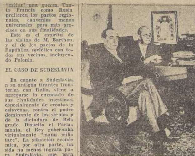
El Ministro francés de Relaciones Exteriores, M. Barthou (a la derecha) con el Presidente de Polonia, Ignacy Mościcki, en el Palacio Presidencial de Varsovia, durante la visita que el primero realizó a la capital polaca.

liticas de Hitler hacia los Balcanes y la Europa Central, y de concertar, al mismo tiempo, un acuerdo con Rusia, que sirviera de apoyo a las miras francesas dentro de la Sociedad de las Naciones, especialmente en vista de la próxima crisis del plebiscito del Sarre, en que ha de definirse la posición de un valioso territorio que está