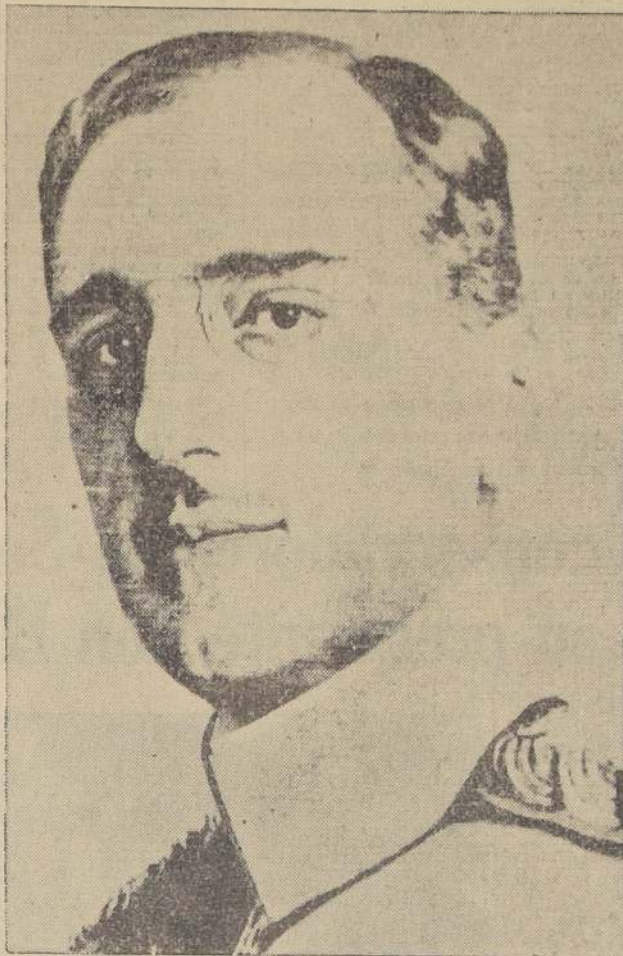
El Rey Alejandro de Sudeslavia, que murió ayer a raíz de un atentado del que fue víctima en el puerto francés de Marsella, poco después de su arribo a aquella ciudad.

Para algunos, esta política de M. Barthou, tan precisa en sus movimientos y tan segura de su finalidad, igual que la de un buen jugador de ajedrez, en el tablero de Europa, era presagio seguro de un futuro conflicto. Según otros, la misma amplitud de sus anillos significaba la mejor garantía de paz. El pacto de París, firmado, hace años, por Estados Unidos, Alemania, Rusia y el Japon, entre otras potencias, ponía la guerra fuera de la ley. Pero Francia primero, y luego Rusia, consideraron que ese convenio tenía más bien un carácter negativo, de abstención; pero que no aseguraba la posibilidad de