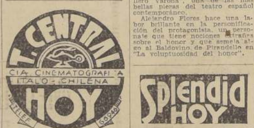
ESPECIAL 6.30 P. M. NOCHE 10 P. M.