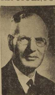
Mr. John Curtin, Primer Ministro de la Commonwealth Australiana

SIDNEY, 4.—(U. P.).—Murió el Premier John Curtin. Curtin padecía de una afección cardíaca, y durante las últimas semanas su salud se resintió apreciablemente. A primera hora de hoy los médicos abandonaron toda esperanza de salvarle la vida.