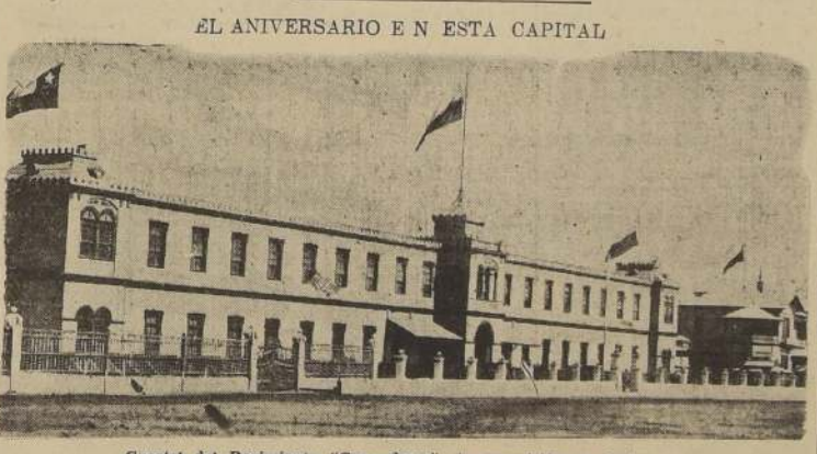
Cuartel del Regimiento "Granaderos", de guarnición en Iquique

CUBRE LA GUARNICION DE IQUIQUE Y OBSTENTA UNA GLORIOSA TRADICION.— ACTUALMENTE ES SU COMANDANTE EL TENIENTE CORONEL DON SANTIA GO ROBLES