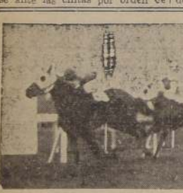
Gazapa bate a Chispita II en los 1.200 metros del clásico "Los Cousins". Tercera a 12 pesquezo se clasifica Agraria delante de Guaquirita y Patagonia

Cumplidos los trámites de rigor, el selecto grupo se dirigió al punto de partida, ubicándose ante las cintas por orden de: