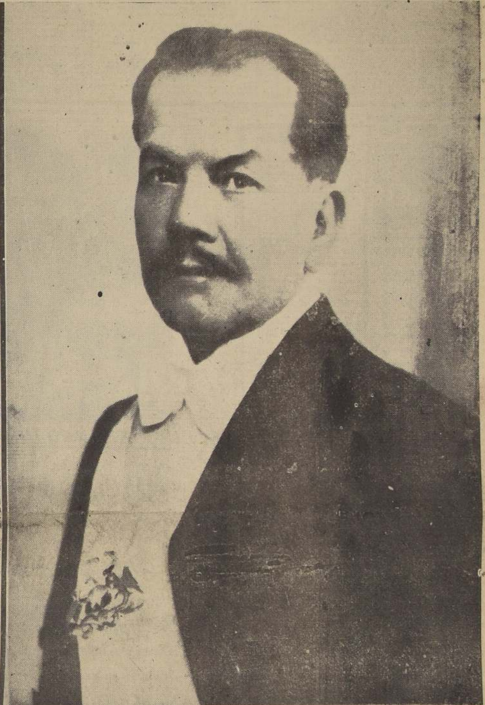
EXCELENTISIMO SEÑOR DON PEDRO AGUIRRE CERDA

"El Ministerio del Interior tiene el sentimiento de comunicar al país el sensible fallecimiento de S. E. el Presidente de la República, don Pedro