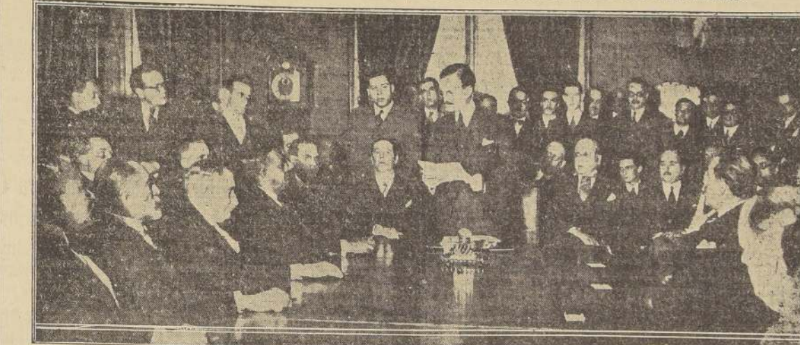
El 27 del mes pasado se verificó en la Cancillería argentina la ceremonia de la firma del Pacto Antibélico de que es autor el Ministro de Relaciones de la Casa Rosada, señor Carlos Saavedra Lamas, por los representantes de doce países americanos. Nuestro grabado presenta al señor Saavedra Lamas en el momento de leer su discurso a los representantes extranjeros antes de proceder a la firma del documento