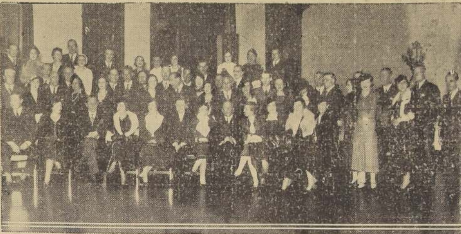
Grupo de damas y caballeros asistentes al Cocktail-Party ofrecido en el Club de Viña del Mar por el Ministro Plenipotenciario del Ecuador Excmo. señor Larrea y Gijón