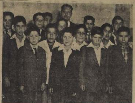
JIRA DE ESTUDIOS. — Un grupo de profesores y alumnos de la Escuela de Rómulo N.º 85, de Maipú, llegó de paso a esta capital y visitó la Cronica de LA NACION. Realizarán una excursión de 16 días, en jira de estudios geográficos, sociales e históricos a través de una gran extensión del territorio de Chile.