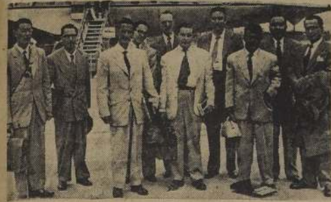
LOS HIJOS DE ARAUCO SALUDAN AL PRESIDENTE