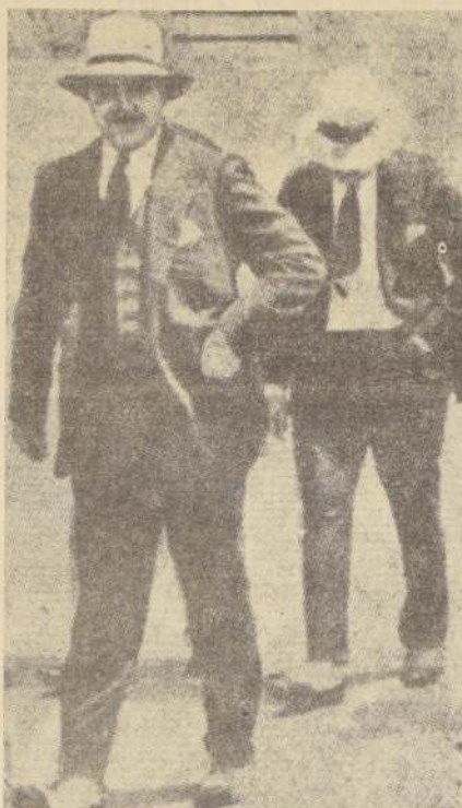
EN LOS TIEMPOS DE AL CAPONE.

NACIONES UNIDAS 4. (UPI). — Cuba acusó hoy a Estados Unidos de haber cometido "un burdo acto de piratería" y de violar la carta de las Naciones Unidas, al detener cuatro barcos pesqueros cubanos que según las autoridades de Washington habían entrado en aguas territoriales norteamericanas. El Dr. Raúl Roa, Ministro de Relaciones Exteriores de Cuba, en carta fechada ayer y dirigida al Consejo de Seguridad, denuncia a Estados Unidos por "un acto de agresión" intolerable cometido en la mañana del día 2 del presente mes por el Gobierno de los Estados Unidos de América al abordar y secuestrar sus "barcos pesqueros" pequeños barcos de pesca de Cuba que efectuaban sus operaciones pacíficas en el llamado "aguero" de la Isla de Dry Tortuga, en aguas internacionales, y con estricto respeto de todas las normas sobre la materia. La carta de Roa está dirigida al Embajador de Brasil, Carlos Alfredo Bernardes, que durante el mes de febrero preside el Consejo de Seguridad. Agrega el Canciller cubano que "esta operación de pesca, en una zona que tradicionalmente ha sido utilizada por pescadores cubanos, fue advertida por el Gobierno de los Estados Unidos, por mediación de la Embajada de Suiza en La Habana, el día 9 de diciembre del pasado año para evitar cualquier fricción con las autoridades norteamericanas que pudiera significar un agravamiento de las tensiones en la zona del Caribe".