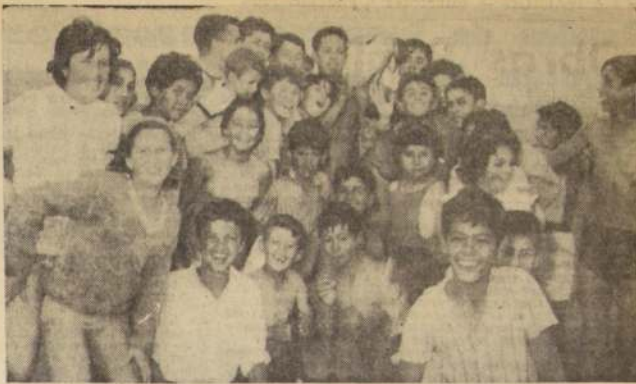
PICHILEMU.— CAPTURA DE UN PINGÜINO.— Recientemente los veraneantes de Pichilemu recibieron la visita de un hermoso pingüino que revolucionó el balneario, hasta que fue capturado por un grupo de niños con la ayuda de todos los veraneantes que participaron en la cacería del pájaro anárquico, que durante largos minutos trató de escapar de la bahía, hasta que fue acorralado por los nadadores. En el grabado, sus captores lo exhiben triunfantes.

SECRETARIA GENERAL DE ESTUDIOS. Santiago, febrero de 1964.