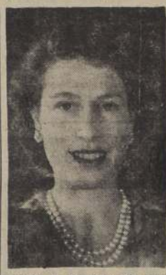
ISABEL II: Habló en Fiji sobre los candentes problemas raciales en el Imperio Británico.

JIRA EFECTUARAN AVIADORES DE USA. BUENOS AIRES, 18 (UP). — El embajador de Estados Unidos anunció que una flota de aviones a retropropulsión pertenecientes a las Fuerzas Armadas de ese país, iniciarán una gira de confraternidad por diversos países de América del Sur. Arribarán a esta capital en la segunda quincena de enero, y será presidida la delegación por el Comandante en Jefe del Caribe, Mayor General Reuben Columbus Hood.