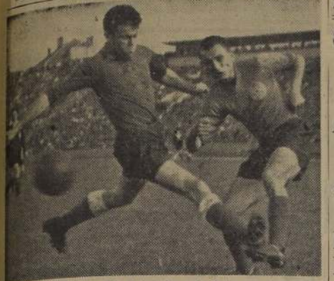
BRANKO ZEBEC. — "Es el jugador más lento que tiene Partizan", han dicho los críticos de toda Europa, refiriéndose al puntero izquierdo del famoso equipo yugoslavo. Con Vukas forman una alia de extraordinaria capacidad, y que ha de constituir una de las atracciones más llamativas en el cotejo del domingo 27, en el Estadio Nacional, frente a Colo Colo. La nota gráfica que presentamos, muestra al notable delantero yugoslavo en acción, frente a Dikic, centro-half de Grvena Zvezda, en un match que es un gran clásico, y en el cual, Partizan se impuso por cuatro tantos contra cero, anotando dos Zebec. Poco antes, el crack de Partizan había integrado el Seleccionado Yugoslavo que batío por goleada al cuadro representativo de Suiza.

Hajduck, dejando grato recuerdo, y el puntero Zebec, por quien tiene gran interés Racing, para incorporarlo desde el año próximo. Hay otra característica saliente de Partizan: es el equipo más popular de Yugoslavia, algo así como Colo Colo en Chile. Tiene más de 25 mil socios y un estadio con capacidad para 80 mil personas.