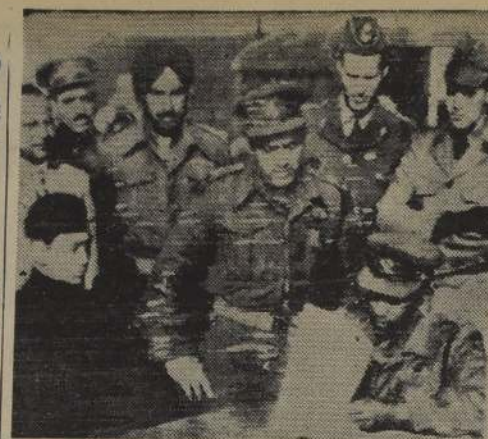
PANMUNJOM (Corea). — El prisionero de guerra surcoreano (sentado), que pasó peligrosamente a través de la barrera de alambre de púa para ganar la libertad el 16 de diciembre, cumple con las formalidades de rigor para poseer la entera libertad en el lado aliado. — (UNITED PRESS RADIOFOTO).

La niebla se extendió sobre 35 condados de Inglaterra, norte de Gales y Escocia. En muchos lugares, la visibilidad llegaba hasta 20 ó 30 metros, pero en otros no pasaba de 10.