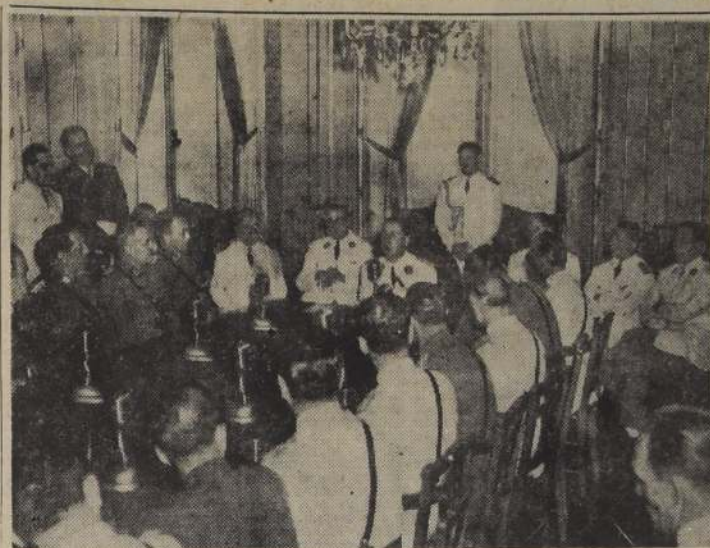
BUENOS AIRES, ARGENTINA. —El presidente de la República, general Perón, conversa con jefes y oficiales del Estado Mayor del ejército chileno, y con el equipo militar argentino que integran los ministros de Defensa Nacional, general Humberto Sosa Molina; de Ejército, general Franklin Lucero; de Marina, contralmirante Aníbal O. Oliveri; y de Aeronáutica, brigadier Juan Ignacio San Martín. La reunión tuvo lugar en uno de los salones de la Casa de Gobierno.

En el salón donde juró el Libertador, se efectuó una conferencia privada entre los dos Mandatarios, en la cual estuvo presente el Canciller argentino. El Primer Mandatario colombiano, Rojas Pinilla, destacó en su discurso, que las invitaciones hechas a Panamá y Venezuela, no eran protocolarias, y advirtió que era tiempo de "que terminen las suspicacias y equívocas interpretaciones" sobre las entrevistas entre Mandatarios de países amigos, ya que éstas no se podían tomar como "agresivas alianzas militares o pactos peligrosos", por el respeto a los pactos y compromisos internacionales.