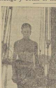
El famoso "navegante solitario", Allain Gerbault, que según noticias últimas, ha declarado querer convertirse en un "salvaje voluntario".

PARIS, 12. (U. P.). — Informaciones llegadas a París del famoso navegante solitario Alain Gerbault dicen que este famoso personaje se encuentra en la actualidad en las Islas Marquesas.