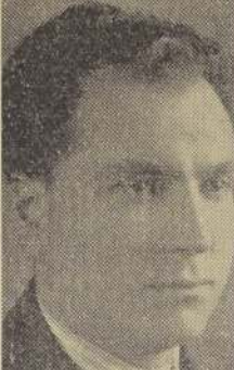
El Ministro del Trabajo, don Alejandro Serani, que recibió al Consejo Ejecutivo de la Confederación Sindical, sosteniendo una detenida conferencia sobre importantes tópicos sociales y aspiraciones obreras.

También expuso el Consejo Ejecutivo al señor Serani la solidaridad de la Confederación con las aspiraciones de los Sindicatos de Obreros Molineros de Santiago y provincias, en pro de mejores salarios; con el memorial en estudio en el Ministerio, de los Sindicatos de Magallanes, sobre diversos puntos; y con los Sindicatos de Rancagua y Sewell que han solicitado se reponga en