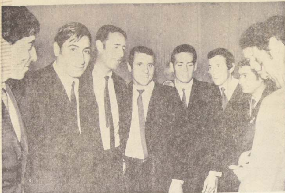
Y así final más contentos que nunca. Los jugadores sonríen y no disimulan su satisfacción.