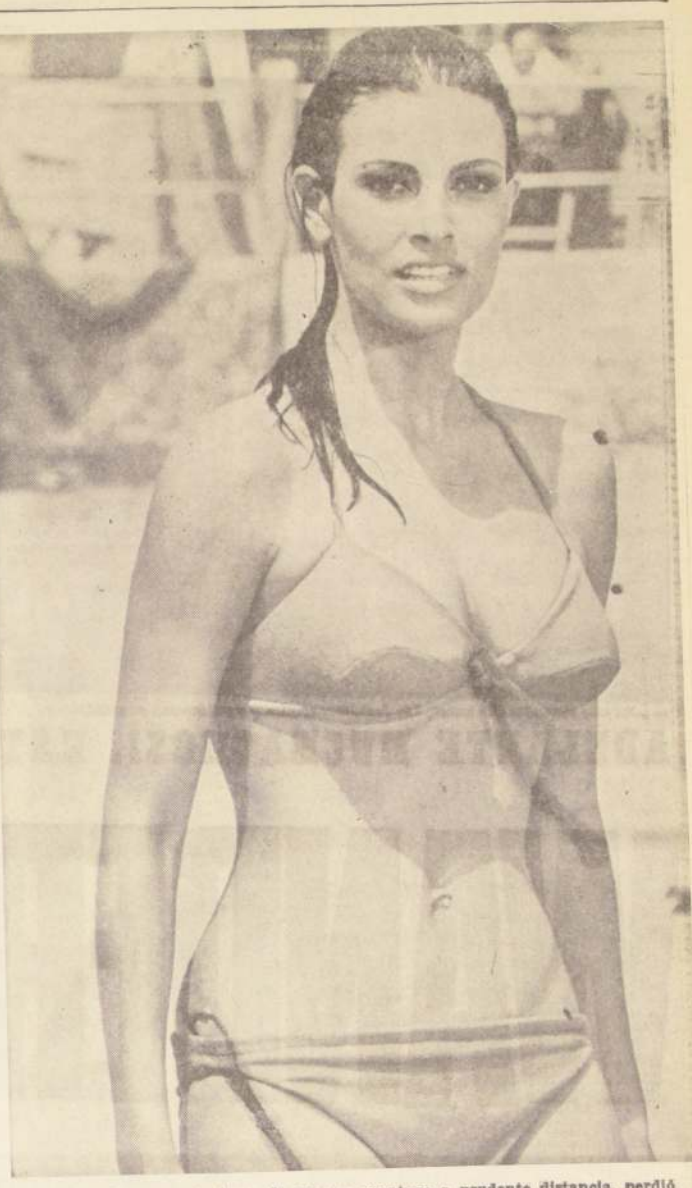
El fotógrafo que en la toma de ayer se mantuvo a prudente distancia, perdió el miedo y se lanzó sobre Raquel Welsh, entregando esta refrescante toma de la actriz saliendo de la piscina corriendo el riesgo de perder todos los quilates. ¿Sería usted capaz de sostener la cámara a tan corta distancia sin que le temblara el pulso? ¡Hay fotógrafos de hielo!