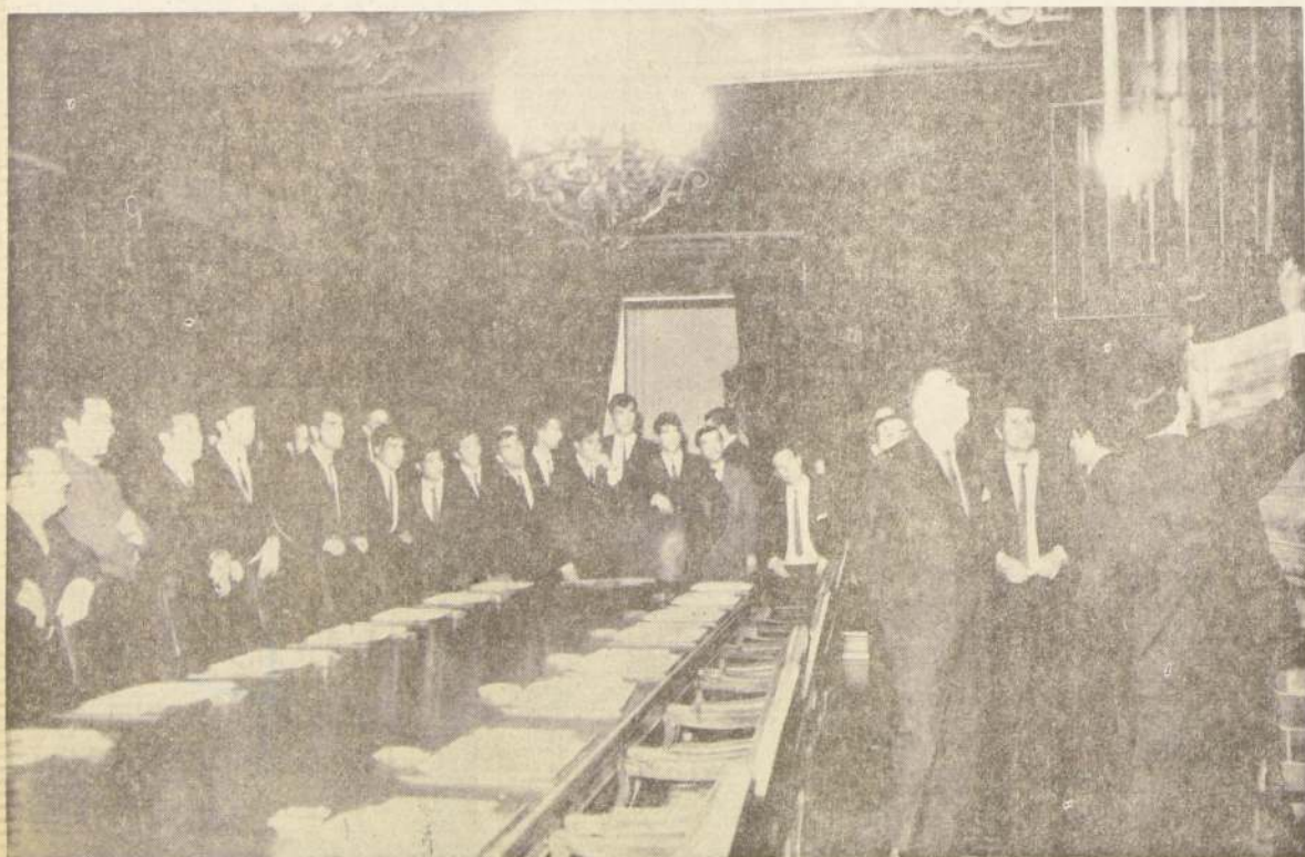
LOS CAMPEONES, recorren las dependencias del Palacio de los Presidentes de Chile y miran con singular interés lo que el anfitrión les muestra.