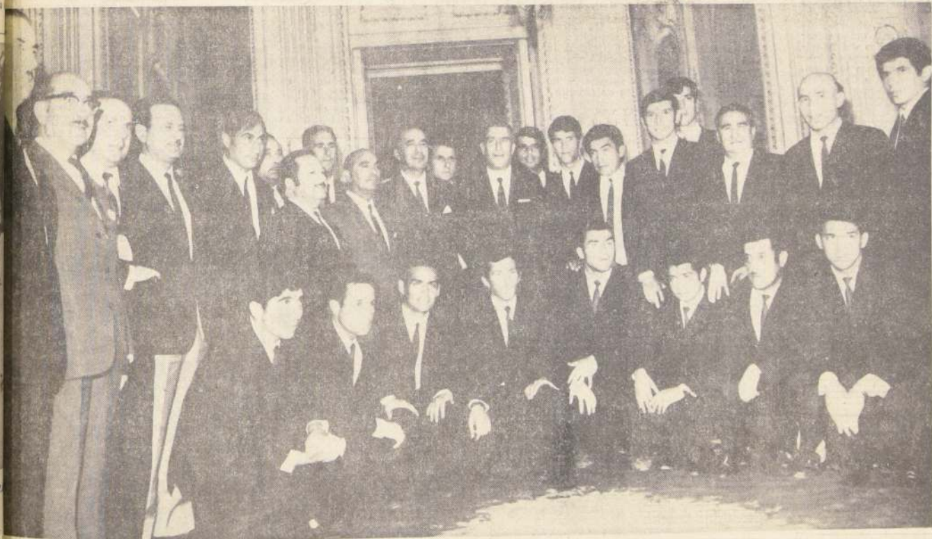
DIJO FREI AL FELICITAR AL CAMPEON: