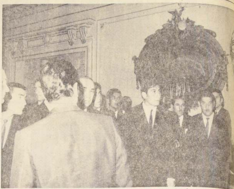
Los campeones aguardan y observan con atención todo lo que les muestra el anfitrión.

¡ADELANTE MUCHACHOS!, ESTA ES LA CASA DE TODOS LOS CHILENOS...!