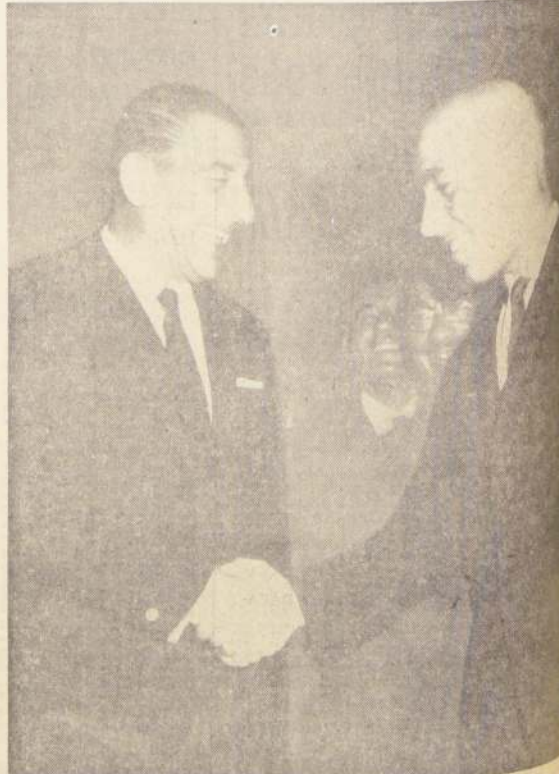
EL PRESIDENTE no puede contener su risa al conocer de labios del propio Capitán del elenco campeón, el porque de su nueva y reluciente calva.