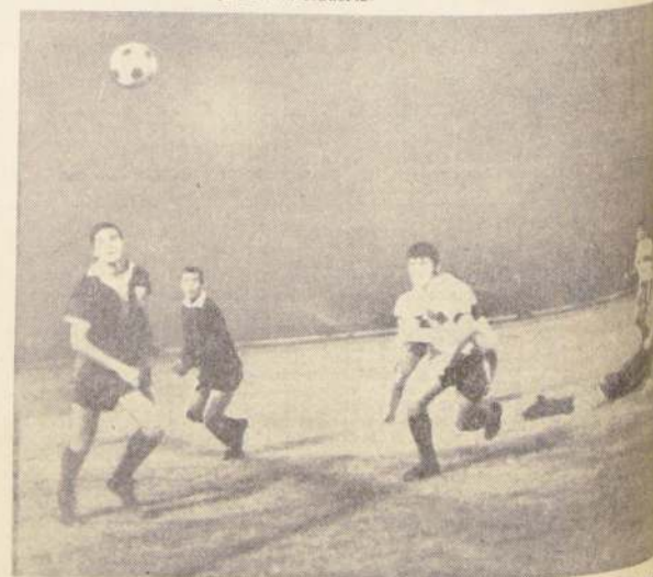
Tres, cuatro oportunidades en la misma jugada tuvo la "U" de marcar en el primer tiempo. El balón golpeó en el poste, en las de los defensas, pero lo cierto, que no entró. En el grabado mira con desesperación cómo el balón se escapa fuera cuando lejos ni Laube pueden alcanzarlo.