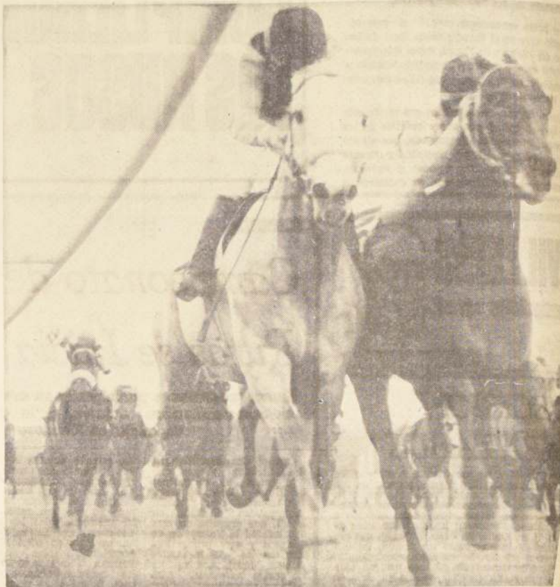
El modesto cuidador de caballos —que nunca ganó mucho— ha sentido la huelga. Apuestas Mutuas en pleno bolsillo. Sus ingresos han bajado.

Si se hubiera pronosticado, este "ganador" (cuánto duraba la huelga) no lo acertaba nadie.