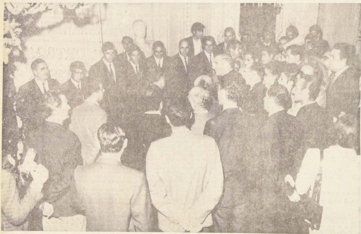
S. E. el Presidente Frei, comparte cordialmente con los jugadores y dirigentes de Santiago Wanderers, en uno de los momentos de la grata reunión del Mandatario con los integrantes del Campeón chileno de fútbol.