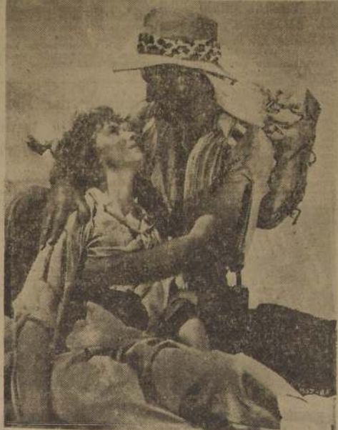
Deborah Kerr y Stewart Granger, estrellas de "Las Minas del Rey Salomón", filmada en tecnicolor en Africa

Fue organizada por la M. G. M para su extraordinaria película "Las minas del Rey Salomón"