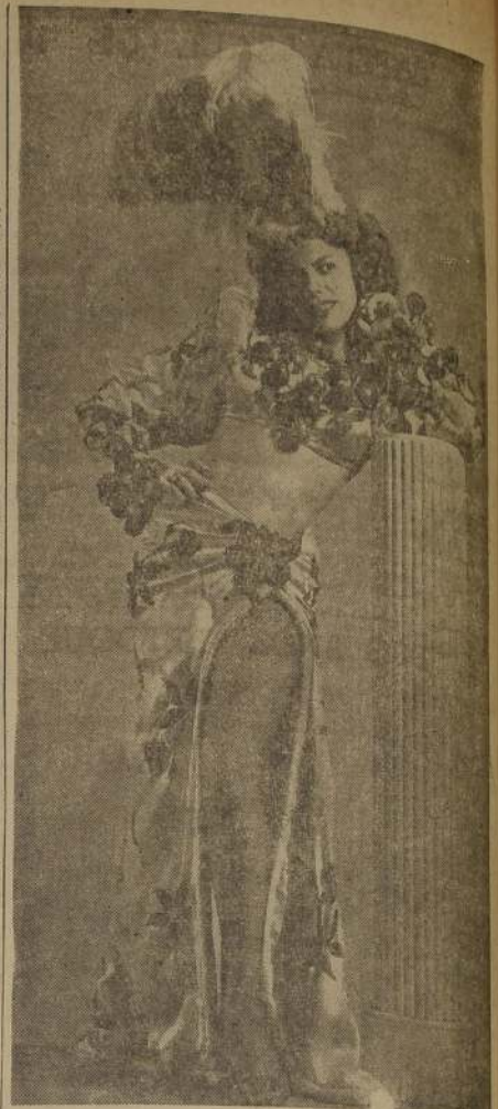
NINÓN SEVILLA, la escultural bailarina cubana, a quien pronto podremos admirar en la película de Producciones Calderón titulada "Víctimas del pecado", en donde, además de lucir su bella y simpática, confirma sus grandes aptitudes artísticas.

Ya se firmaron los respectivos contratos con una compañía de títeres y una compañía de juegos mecánicos para que se presente en la Exposición de los Ferrocarriles, Industrias y Comercio, que será inaugurada en los primeros días de marzo. Estos dos conjuntos ofrecerán un espectáculo novedoso, el que ya está ensayándose. En diversos escenarios actuarán artistas nacionales y extranjeros. Serán varias las sorpresas artísticas que tendrá este torneo.