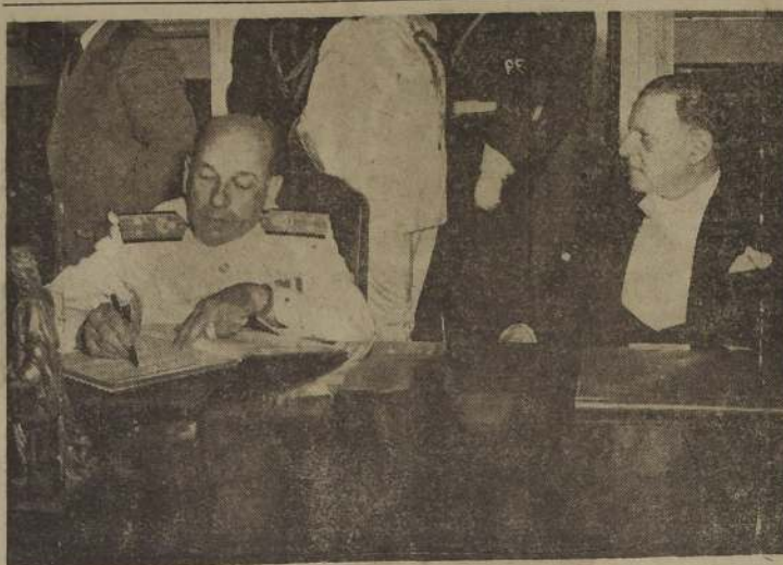
RIO DE JANEIRO.—Los Ministros de Marina, almirante Nelson Guillobel y de Hacienda, Horacio Lafer, firman su ingreso al primer Gabinete del Presidente de Brasil, Excmo. señor Getulio Vargas.

Otros acontecimientos durante la semana: Los ferrocarriles (en la semana anterior al comienzo de la huelga) trasladaron 23.3