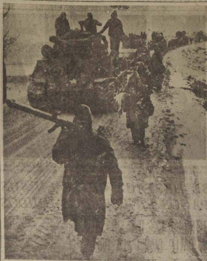
Por los caminos cubiertos de nieve, avanzan las tropas de la NU, acompañadas por los tanques. En la batalla por Seúl participan activamente las columnas blindadas de la fuerza aliada.

La Asociación dijo que esas películas serán "Valentino", de Columbia; "Intruder in the Dust", de Metro; "Boulevard", de Paramount; "Arenas de Iwo Jima", de Republic; "Our Very Own", de Samuel Goldwyn; "Treasure Island", de Walt Disney-R. K. O.; "Halls of Montezuma", 20th Cen.