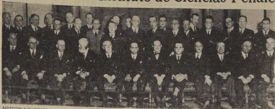
Asistentes a la comida con que los miembros del Instituto de Ciencias Penales celebraron el primer aniversario de su fundación.