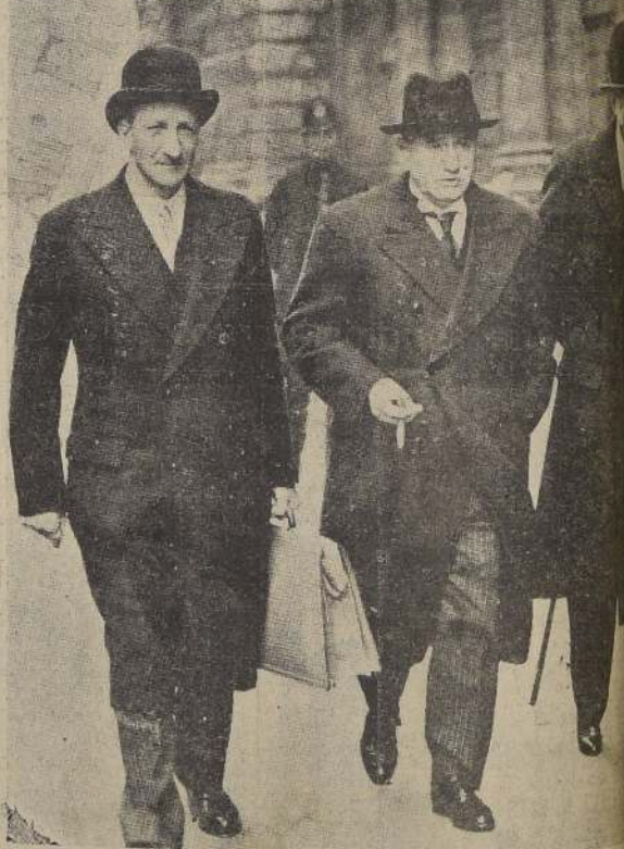
Los señores Georges Bonnet, Edouard Daladier y Corbin (Embajador de Francia en el Foreign Office, durante la reciente visita efectuada a la capital inglesa, para "LA NACION", por el correo aéreo de la "Air France").

ácido, más corriente pasa por la solución. En esta forma, el aparato indica cuánto tiempo ha pasado desde la muerte del animal, sea superior o inferior.