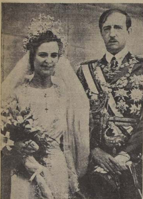
Fotografía tomada en el momento del matrimonio del Rey Zog II de Albania y la Condesa Geraldine Aponyi.