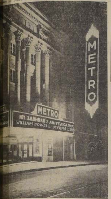
Fachada del Teatro Metro

En el mes de mayo, con la cooperación de la prensa, que dedica a los días de aniversario de Metro, una gran campaña de propaganda, se celebrará el segundo aniversario de la fundación de este teatro. En la noche del domingo 14, se presentará la película "Boda por partida doble", de William Powell y Myrna Loy. Esta producción es una comedia de gran éxito, que ha sido presentada en los mejores teatros de los Estados Unidos. La película es una obra maestra de la comedia, que ha sido presentada en los mejores teatros de los Estados Unidos. La película es una obra maestra de la comedia, que ha sido presentada en los mejores teatros de los Estados Unidos.