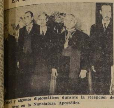
Algunos diplomáticos durante la recepción de ayer en la Nunciatura Apostólica