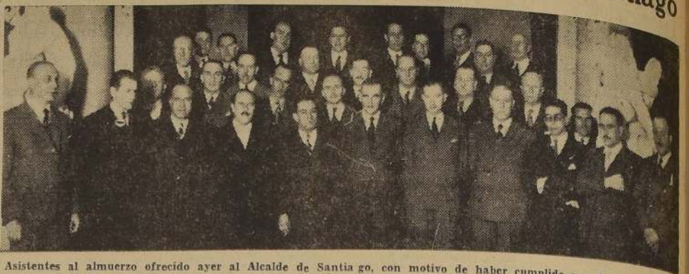
Asistentes al almuerzo ofrecido ayer al Alcalde de Santiago, con motivo de haber cumplido un año de administración municipal.

El Primer Mandatario se refirió en esta oportunidad a la importancia de las labores que les correspondía realizar y les dio instrucciones acerca de la manera como deberían desempeñar sus funciones.