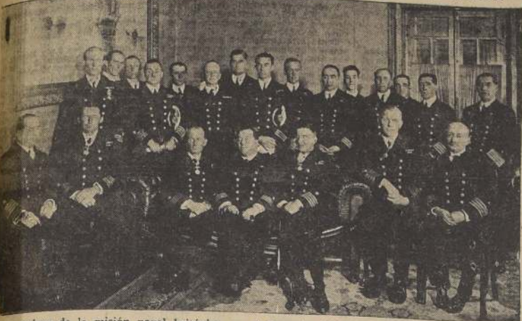
Los marinos de la misión naval británica en el despacho del Ministro de Marina a mediodía de ayer, al ser condecorados por nuestro Gobierno

BRITANICOS EL BANQUETE DE ANOCHE EN EL CLUB DE LA UNION