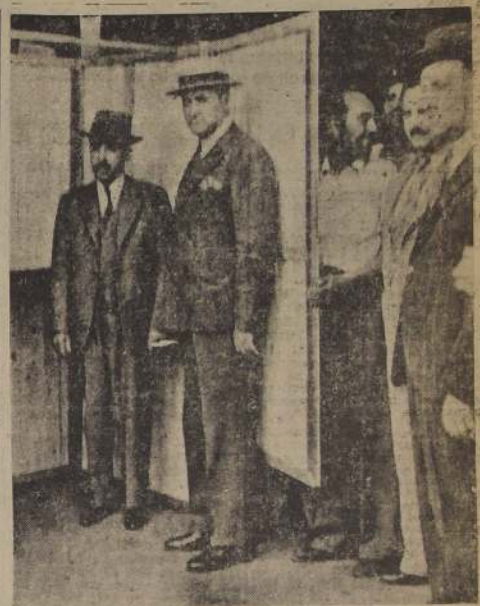
El Ministro del Interior y el Intendente de Santiago durante su visita de ayer al local donde se construyen las cámaras secretas

Hemos sabido, además, que se investigan diversos cargos hechos a un alto funcionario de Santiago, quien habría obrado