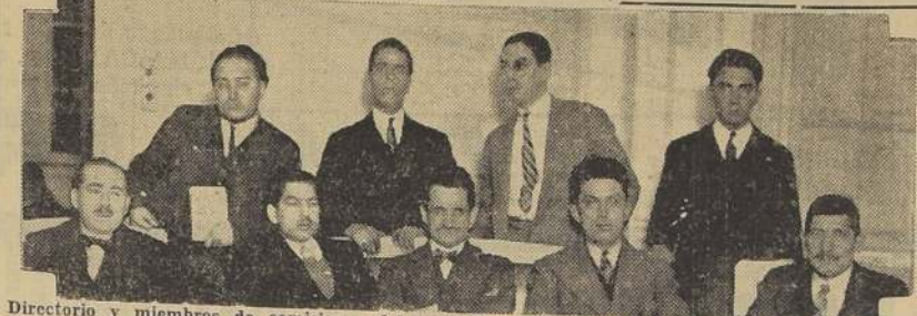
Directorio y miembros de comisiones del "Sindicato Profesional de Sastres", en su visita a "La Nación"