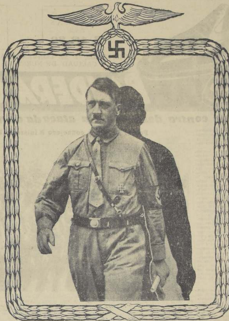
A. HITLER — REICHSFUEHRER

Es el tercer paso en el plan nazi; su propósito es elimi-