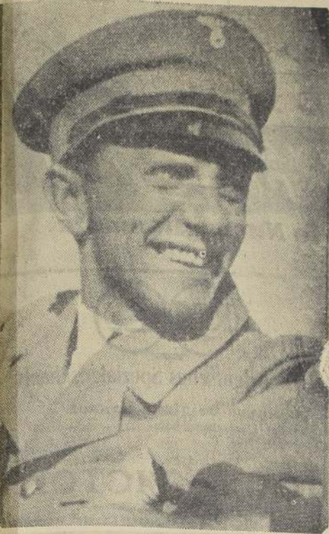
Dr. JOSEPH GOEBBELS MINISTRO DEL REICH

En muchos círculos se halla una profunda opinión de que el movimiento nacional-socialista conquistó el poder en Alemania con ayuda de la violencia y del terrorismo y que ahora abusa de su posición para aniquilar brutalmente a sus adversarios políticos. Esta tendencia es del todo inexacta. El movimiento nacional-socialista era ya antes de la subida al poder el partido mayor y más influyente de la Alemania parlamentaria y fue requerido legalmente para que asumiera la responsabilidad, consolidando su autoridad igualmente con medios legales. Siendo así, no podía tratar de ejercer terrorismo o de hacer uso de la fuerza. En Alemania no ha habido jamás un gobierno que haya podido afirmar con más razón hallarse en perfecta armonía con las anchas masas del pueblo que el gobierno nacional-socialista.