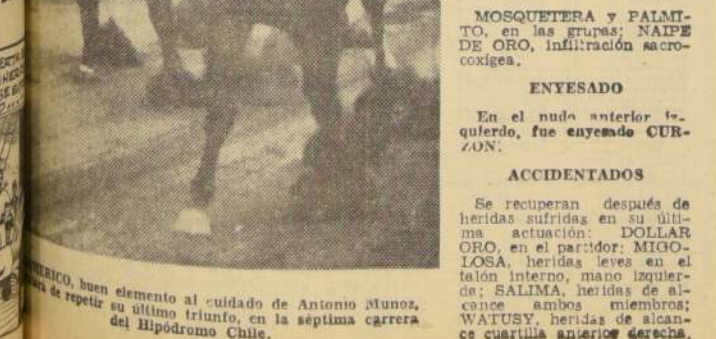
MIGUOLA, buen elemento al cuidado de Antonio Muñoz, repitió su último triunfo, en la séptima carrera del Hipódromo Chile.

ACCIDENTADOS Se recuperan después de heridas sufridas en su última actuación: DOLLAR ORO, en el partidor; MIGUOLA, heridas leves en el talón interno, mano izquierda; SALIMA, heridas de alcance ambas miembros; WATUSY, heridas de alcance cuartilla anterior derecha.