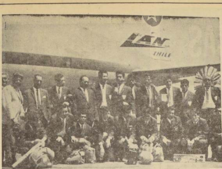
EL CUADRO DE COQUIMBO CRAV, uno de los grandes del fútbol penquista, regresó ayer de una gira por canchas del norte, donde realizó una excelente campaña. Anoche mismo los integrantes del team de Penco siguieron viaje a esa localidad.

Este match tendrá un carácter benéfico y formará parte de un festival que organizará el Club de Leones, con el fin de contribuir a las obras sociales que realiza la esposa del Primer