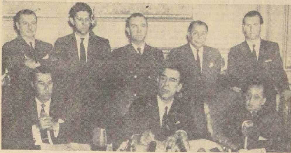
EN EL GRABADO, el Presidente de la República, Eduardo Frei, en un pasaje de su exposición sobre Promoción Popular, y que constituyó un acto de enorme trascendencia social. A la derecha, el Ministro del Interior, Bernardo

★ Nuestro objetivo consiste no sólo en un desarrollo económico, sino en un desarrollo social, que nacerá en los barrios, sindicatos o centros de madres.