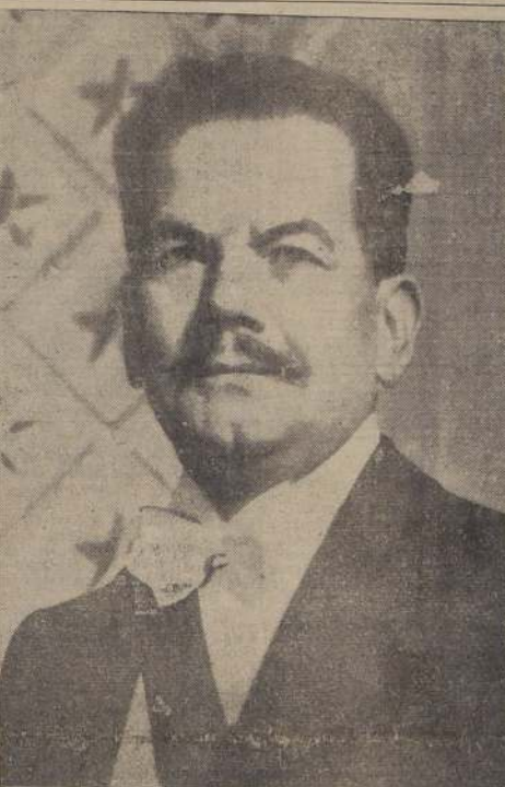
Excmo. señor don Pedro Aguirre Cerda.

2) Como la violencia con que se combaten las naciones en guerra, puede seguir estrechando el círculo de nuestras relaciones comerciales, dificultar y encarecer el aprovisionamiento de materias primas, maquinarias y los transportes indispensables, se impone la necesidad de una unión