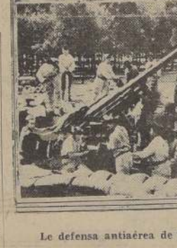
La defensa antiaérea de París.

LONDRES, 3. — (U. P.). — Su Majestad el Rey ha enviado a Mr. Churchill el siguiente mensaje: "Deseo expresar mi admiración a la excepcional energía y valor de que han dado prueba los tres servicios de la marina mercante en la evacuación de las Fuerzas Expedicionarias británicas del norte de Francia". "Una operación tan difícil solo ha podido ser ejecutada gracias a la brillante dirección y espíritu indomable que han sido comunes a todas las fuerzas sin distinción de grados." "Su Excelencia, mayor al que nos hubiéramos atrevido a esperar, ha sido debido en gran parte al apoyo inflexible de la Real Fuerza Aérea y en la última fase a los esfuerzos incansables de las unidades navales de todas las categorías." "Mientras aclamamos este hecho memorable en el que nuestros aliados franceses han tenido también un papel importantísimo, pensamos con sentimiento en los terribles sufrimientos de aquellos bravos cuyo sacrificio tornó un desastre en un triunfo". Firmado: "Jorge VI".