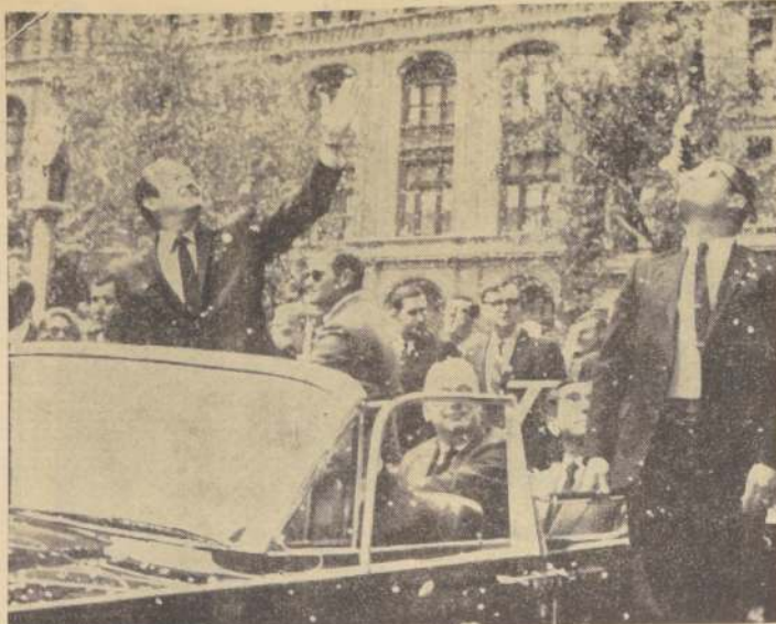
El Vicepresidente de los Estados Unidos y candidato demócrata a la Presidencia, Hubert Humphrey, saluda a sus partidarios durante su campaña, que hasta el momento parece seriamente amenazada por la popularidad de Richard Nixon.