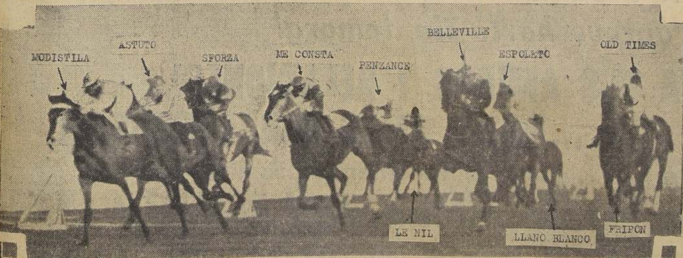
que se disputó ayer en el Club Hípico.