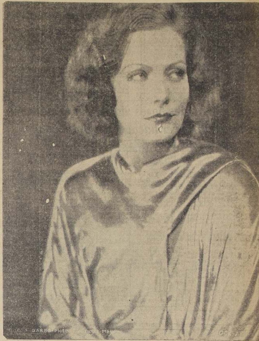
ARGUMENTO EN CINE-NOVELA

GRETA ES LA SEDUCCION MISMA. NINGUNA ACTRIZ POSEE LA MARAVILLOSA BELLEZA Y EL ENCANTO VOLUPTUOSO DE ELLA. "EL BESO" ES SU PELICULA MAS PASIONAL, DRAMA DE UNA MUJER INCOMPRENDIDA POR SU MARIDO Y ANSIOSA DE AMOR. LOCALIDADES NUMERADAS EN VENTA. — OBTENGA HOY MISMO LAS SUYAS.