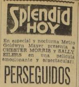
En especial y nocturna Metro Goldwyn Mayer presenta a CHESTER MORRIS y SALLY EILERS en una película emocionante y espectacular: