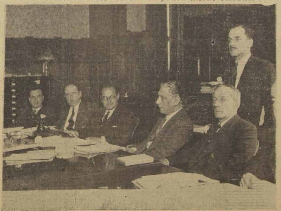
El Ministro de Salubridad y otros miembros del Consejo Nacional de Salubridad durante la sesión de ayer

DISCURSO DEL MINISTRO, DOCTOR DON JAVIER CASTRO OLIVEIRA