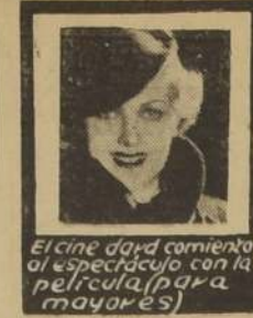
El cine dará comienzo al espectáculo con la película (para mayores)