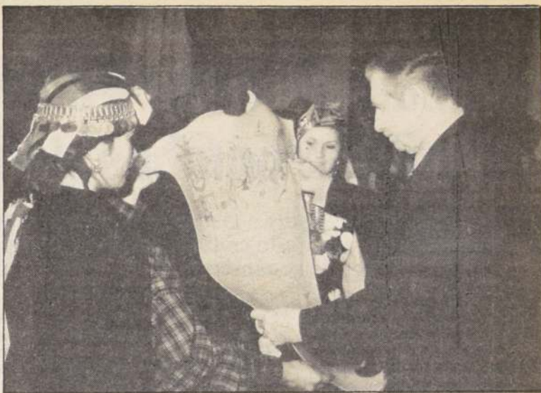
Los dirigentes agrícolas de las comunidades mapuches de la IX Región, le entregaron al Presidente Pinochet, como se aprecia en la fotografía, un pergamino conteniendo las firmas de adhesión de los representantes de la Araucanía y de los caciques de Nueva Impe- rial.

Más adelante reseñó que exis- te un "muy buen clima en las relaciones bilaterales" y lo im- portante de este segundo en- cuentro de jefes de estados ma- yores es "crear un marco de re- ciproca confianza que permita gradualmente mayores avances en este importante tema".