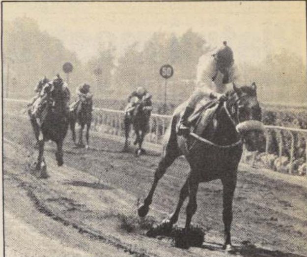
TORIL no dejó dudas respecto a su extraordinario momento; ayer alcanzó su segundo éxito consecutivo de jerarquía en la arena del Hipódromo Chile.

Ganada por 1. 3/4 cpo., el 3° a cba., el 4° a 2.1/4 cpos., el 5° a 3/4 cpo., el 6° a 1/2 cpo. Tpo. 1.14.1/5. No corrió (14) Rancho. Prep.: Boril Benito Ch., Div. $ 19,20 5,60 6,20 2,40. Quinela: $ 47.800.— Comb.: 9 con 15. Trifecta: $ 78.470.— Comb.: 9 con 15 y todos.