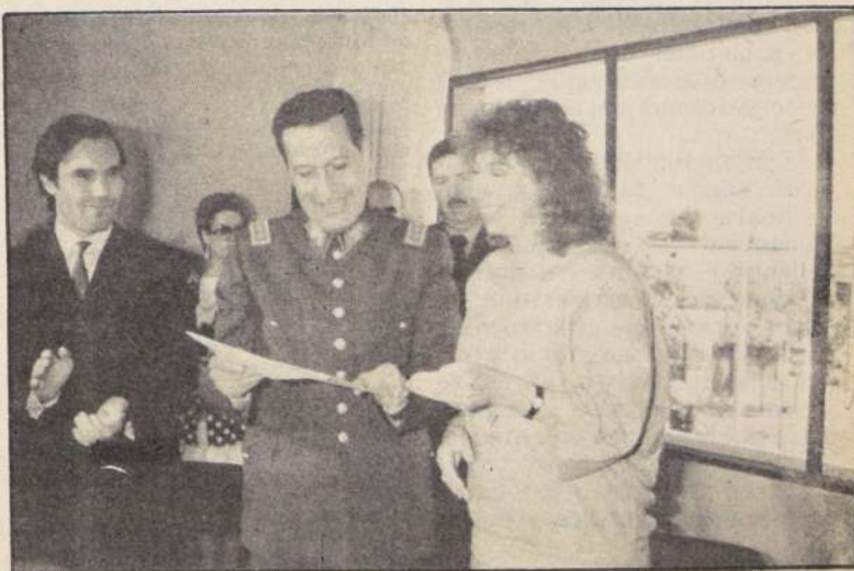
Quinientos profesores recibieron becas para formarse como coordi- nadores culturales. La acción es impulsada por las autoridades educacionales y la Corporación Nacional de la Cultura, cuya presi- denta Lucía Pinochet Hiriart aparece entregando las becas al in- tendente Sergio Badiola, observa Jaime Orpis, alcalde de San Jo- aquín.

Agregó que la entrega de be- cas constituye un hito, por cuanto significa "el comienzo de la difusión de la cultura", es un acto en el que se proyecta la cultura nacional, que hay que conocerla y sentirse orgulloso de ella, al igual como nos senti- mos orgullosos de ser chilenos.