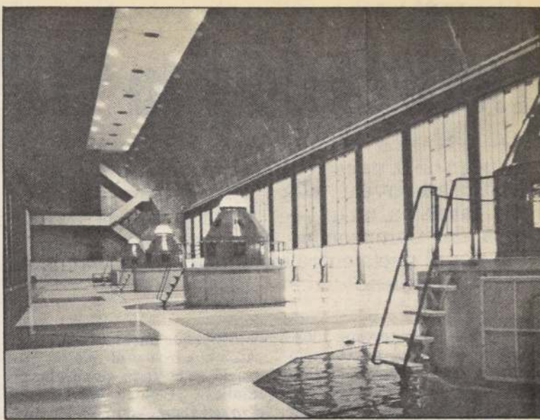
La central hidroeléctrica El Toro, forma parte del patrimonio de la Empresa Nacional de Electricidad, ENDESA.

taje máximo de concentración permitido será del 20 por ciento de las acciones sucritas y que mientras el fisco directa o indirectamente sea dueño de un porcentaje superior al 50 por ciento de las acciones suscritas, y en tanto exista dicha situación, podrán mantener la propiedad de dicho porcentaje, siempre que venda o se comprometa a vender el 30 por ciento de los títulos.