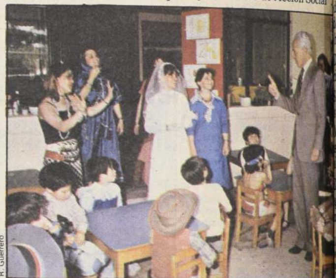
Con disfraces, los vecinos de la 10ª agrupación vecinal esperaron al alcalde Gustavo Alessandri, en el marco de la acción social del municipio.

Asimismo, se efectuaron actividades recreativas y deportivas, lo que permite, según dijo el alcalde, "controlar la eficiencia con que labora el personal municipal perteneciente al Departamento de Acción Social".