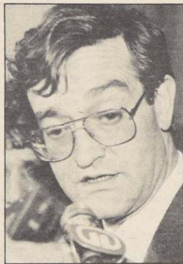
El Ministro Juan Antonio Guzmán hizo un llamado a la reflexión a la comunidad universitaria y señaló que el plantel volverá a la normalidad.

Guzmán hizo anoche un llamado a la comunidad académica y a los estudiantes del plantel "para que reflexionen sobre esta iniciativa, y confíen en que las autoridades de Gobierno y muy principalmente S.E., el Presidente de la República, como lo demostró en el día de ayer, está muy preocupado por la situación de la Universidad de Chile".