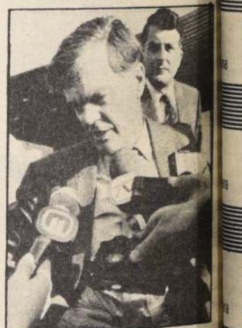
"Mi interés es mejorar las relaciones comerciales con Chile", señaló el Ministro de Comercio del Reino Unido, Sir Alan Clark.