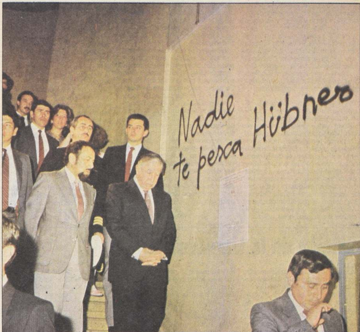
Durante diez minutos, el Jefe del Estado, Augusto Pinochet, recorrió las dependencias de la Facultad de Derecho de la Universidad de Chile y se impuso de los rayados y destrozos que un grupo de exaltados realizó en la mañana del martes pasado