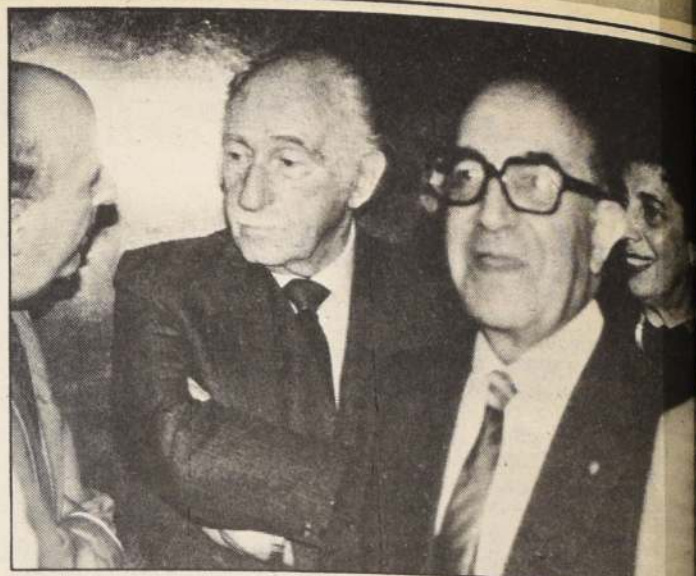
Los dimisionarios integrantes de la junta directiva al término de la reunión con el Ministro Guzmán.

"Hemos puesto los cargos a su disposición precisamente porque confiamos en su solución. De ninguna manera lo hemos hecho porque hayamos cambiado de pensamiento res-