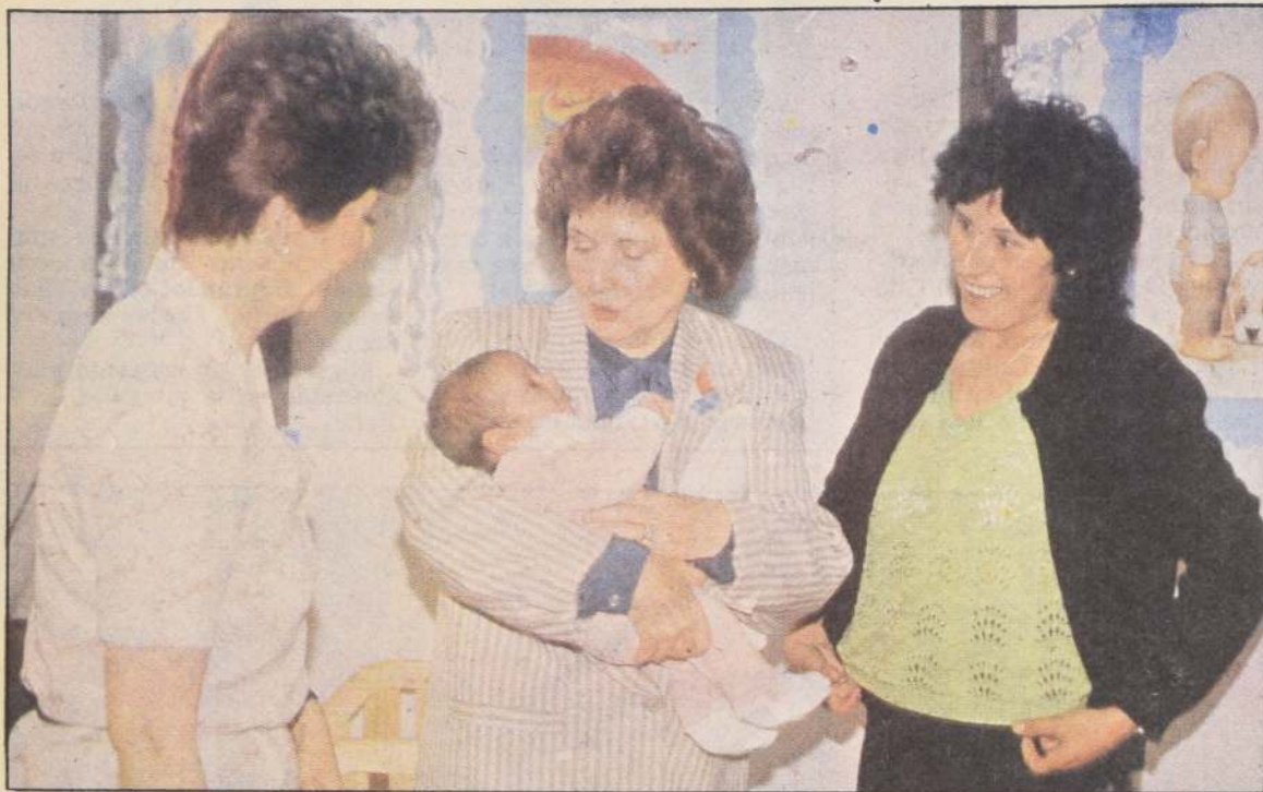
La Primera Dama, en un gesto habitual, le hace cariño a un recién nacido, hijo de una socia del Centro de Madres Luz y Progreso.

Primera Dama entregó ajueros e inauguró policlínica