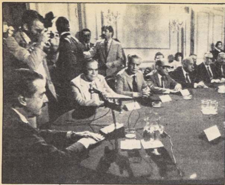
El Presidente argentino Raúl Alfonsín (izquierda) preside una reunión con los líderes de todos los partidos políticos con representación parlamentaria, en el Palacio San Martín en Buenos Aires. Alfonsín convocó a los dirigentes políticos para presentar las líneas generales del "acuerdo político de gobernabilidad", abriendo así las negociaciones para lograr un pacto político y social. (Reuter).