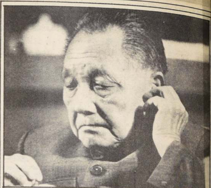
El líder chino Deng Xiaoping ajusta sus fonos para escuchar durante la sesión inaugural del 13º Congreso del Partido Comunista Chino. Delegados del Congreso dijeron que el partido estaba dividido en relación a si Deng Xiaoping debería retirarse.

El funcionario soviético no habló con los periodistas occidentales, que no fueron autorizados a acercarse a Shevardnadze ni a su colega checoslovaco Bohuslav Chnoupek que acudió a recibirle.