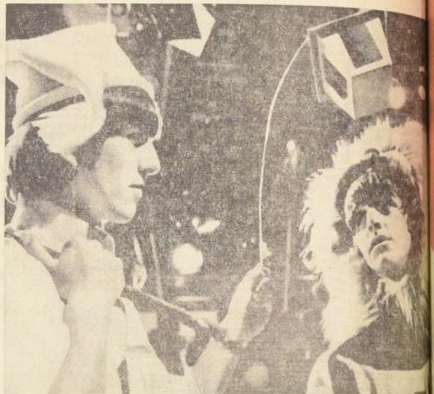
Los Beatles han encabezado algunas de las mayores aventuras de nuestro país: un estilo de música con claras influencias orientales, la difusión de melodías alucinógenas, y ahora, en forma inesperada, protagonizan una vez más sus imágenes, llevadas al dibujo animado, una fascinante historia fotográfica, realizada por el dibujante alemán Heinz Edelman, 34 años, dueño de Bosch y Audrey Beardsley y sus dibujos satánicos.

mod". El submarino amarillo, pais de los juguetes de la era de los psicodélicos de los Beatles, formas oníricas de dibujos animados, toxicomanas a esta palanca. Aparentemente dedicado a la realidad sentimental de los Beatles, el film es, en realidad, una alegoría de la edad del amor, y el ensueño, la idea de la vida, el destino de la verdadera vida. "El submarino amarillo" es un grupo de norteamericanos, el verdadero creador, el artista, la fantasía cinematográfica, las canciones de los Beatles, una 34 años, Heinz Edelman, un trabajo para la revista "Eurek" de la revista "Eurek", un principiante. Los dibujos animados se cruzan entre las imágenes de Bosch y los dibujos de Aubrey Beardsley.