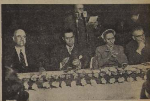
MANIFESTACION EN EL GOYESCAS.— Mesa de honor de la manifestación al presidente del Partido Nacional Cristiano, señor José Musalem. De derecha a izquierda: Ministro de Tierras, señor Venancio Cofrepeán; senadora María de la Cruz; el homenajeado, señor José Musalem S., y el Ministro del Interior, señor Guillermo de la Cruz.

Terminó diciendo, el señor Musalem, que "estaba seguro de que por esta senda de sacrificio, de lucha y vigilia al lado del Gobierno y al lado de los trabajadores, y al lado de la líder máxima de ellos, María de la Cruz; y al lado de los demás partidos de avanzada social, lograrían para las generaciones venideras, un Chile grande, próspero y cristiano".