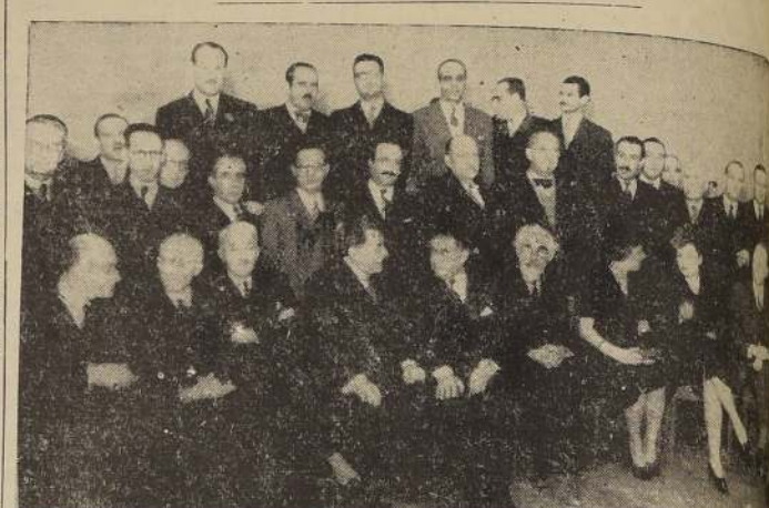
Asistentes al cocktail ofrecido ayer en el Crillon por el Ministro de Cuba, al ilustre poeta de Jerusalem, señor Nathan Bistritzky

EL ILUSTRE POETA Y MIEMBRO DEL PEN CLUB MUNDIAL FUE OBJETO DE UN ESPECIAL HOMENAJE EN EL CRILLON