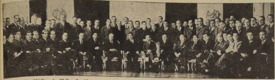
La Asociación Médica de Chile ofreció un almuerzo a los delegados que asistieron a la reciente Convención Extraordinaria que se celebró en esta capital.