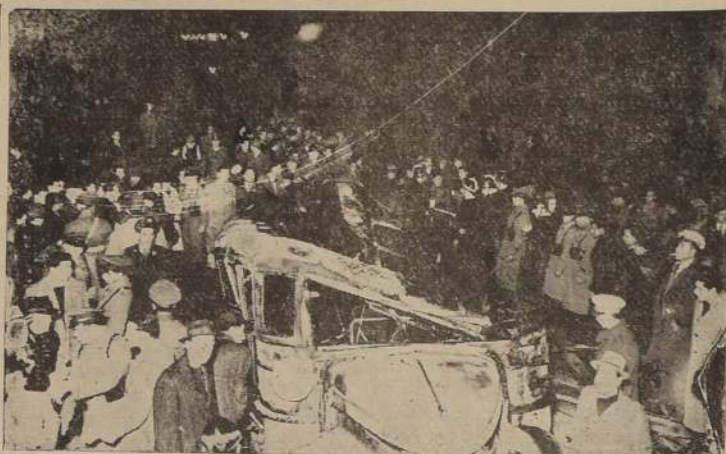
Estado en que quedó el micro después del horroroso accidente de ayer

El accidente se produjo debido a que el guardavías no bajó las barreras, de modo que el micro cruzó la línea férrea en los precisos momentos que pasaba la locomotora. El micro fue chochoado por la parte trasera y lanzado violentamente a más de 20