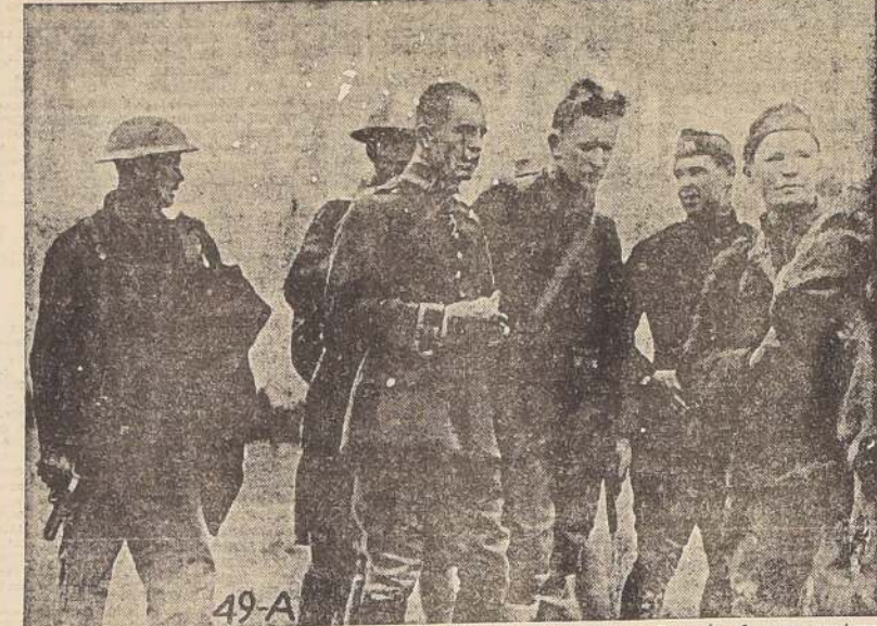
Interesantísima fotografía del aviador alemán Marwade, momentos después de ser capturado por los norteamericanos en espectacular batalla aérea