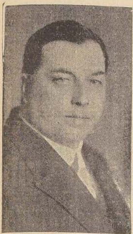
El Ministro del Interior, don Carlos Froedden, que ha desarrollado una amplia labor para llevar a feliz término el Contrato Eléctrico

En la tarde de ayer el Ministerio del Interior ha dado curso a un decreto con fuerza de ley, por el cual aprueba el contrato eléctrico suscrito el mismo día entre los representantes de la Municipalidad de Santiago y de la Compañía Chilena de Electricidad Limitada.