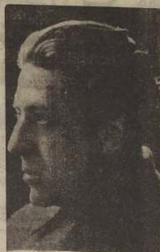
Pedro Sienna, actor de reconocido prestigio, que trabaja por formar a un grupo de aficionados que mantendrá encendida la luz del teatro chileno.

Después de más de veinte años, según indica el Reglamento del Premio Nacional de Arte, el actor de teatro, según lo establece la ley respectiva, es el más meritorio de los actores nacionales. Su labor a través de largos y angustiosos años de lucha teatral sería merecidamente reconocida por el Premio Nacional de Arte. Desde sus primeros años juveniles estuvo al frente de las grandes compañías del teatro, en sus mejores años los dejó en las tablas y ahora, cuando ya las canas se pintan en sus cabellos, no ha querido abandonar la escena. No habiendo lugares donde el actor profesional pueda entrar su alma y sus inquietudes, Pedro Sienna ha buscado en el germen del teatro chileno, en el símil y en los centros culturales obreros, ese último refugio para no abandonar el arte hispanoamericano. Allí ha dejado sus experiencias, ha ido cultivando los entusiasmos y la actualidad, y ha formado actores y actrices que mantendrán, a su vez, encendida la luz del teatro chileno, tan de capa caída en nuestro tiempo. Toda esta labor es meritoria. Y se hace aún mayor, cuando se descubre que Pedro Sienna nunca ha recibido subvención por estas labores. El Premio Nacional de Arte debe quedar en sus manos.