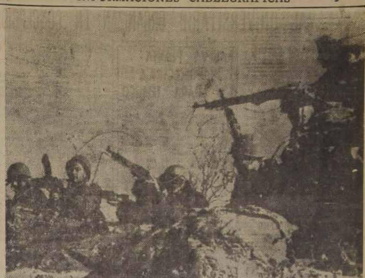
EN UN PUNTO AVANZADO DE LAS TROPAS GRIEGAS. — Comandos griegos, con armas y equipos norteamericanos, se disponen a contraatacar las posiciones de los guerrilleros comunistas griegos, que en número superior a siete mil se han visto obligados a retroceder más allá de sus reducidos en las cimas de las montañas que miran ya hacia Albania y Yugoslavia. El 13 de agosto, estos guerrilleros comunistas huyeron hacia territorio albanés, seguidos de cerca por el Ejército griego regular.

TOKIO, 16. — (U.P.) — El Ministro sin cartera nacionalista chino Wu Teh-chen, dijo que Chiang Kai-shek, dijo que el Gobierno nacionalista resistiría durante "meses y años" en el sur y oeste de China, trasladando su capital a Chungking cuando Canton cae.