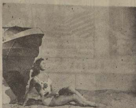
La popularidad de la bella Esther Williams alcanza su punto culminante con la comedia "El recuerdo de tus labios". — tan sólo pueden realizar los estudios del popular "León" de la Metro.

Un espectáculo jamás igualado estrenará mañana el Teatro Metro. "El recuerdo de tus labios", soberbia comedia musical filmada en preciosos technicolor, nos trae otra vez a la exquisita arena de M. G. M., Esther Williams, secundada por un seleccionado reparto que incluye a Laurita Melchior, Johnny Johnston, el inolvidable Jimmy Durante y la gran orquesta espectacular que dirige Xavier Cugat. Las bellezas más estupendas de Hollywood, las más célebres, los mejores actores y estrellas melódicas tropicales se admirarán realizadas por la magia del technicolor.