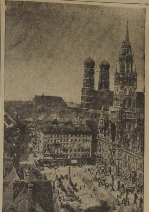
Una vista de la ciudad de Munich

Reichstag y otros puntos centrales, entre los cuales se encuentran el Reichstag, el Ministerio de Propaganda, la Cancillería del Reich y el Museo, se encuentran protegidos por complicadísimas defensas. Hay obstáculos de focos de luz en todos los cruces de las calles, y una enorme cantidad de tranvías cargados con piedras, y casamatas grandes y pequeñas, cierran el paso.