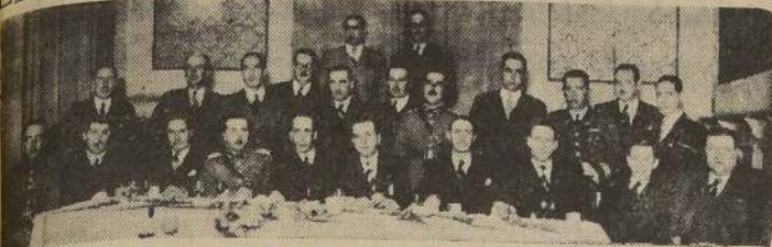
Reunión ofrecida en los salones del Tong-Fang por los ex alumnos del Colegio RR. PP. Franceses del curso del año 1922, celebrando su tradicional reunión de camaradería.