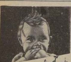
Fuerza, salud y belleza

VICHY, 12. (U. P.). — El presidente del Consejo de Ministros de Francia, Paul Reynaud, anunció que la Comisión Económica Internacional se reunió hoy en París. La Comisión, que fue creada por el Tratado de Versalles, tiene el propósito de estudiar los problemas económicos que surgen de la guerra y de proponer medidas para su solución. La Comisión está compuesta por representantes de Francia, Inglaterra, Estados Unidos, Canadá, Australia, Nueva Zelanda, Polonia, Checoslovaquia, Grecia, Yugoslavia, Luxemburgo, y el representante del movimiento de los franceses libres. La Comisión se reunirá durante tres días, del 12 al 14 de junio, y luego se reunirá nuevamente el 16 y 17 de junio. La Comisión tiene el propósito de estudiar los problemas económicos que surgen de la guerra y de proponer medidas para su solución. La Comisión está compuesta por representantes de Francia, Inglaterra, Estados Unidos, Canadá, Australia, Nueva Zelanda, Polonia, Checoslovaquia, Grecia, Yugoslavia, Luxemburgo, y el representante del movimiento de los franceses libres. La Comisión se reunirá durante tres días, del 12 al 14 de junio, y luego se reunirá nuevamente el 16 y 17 de junio.