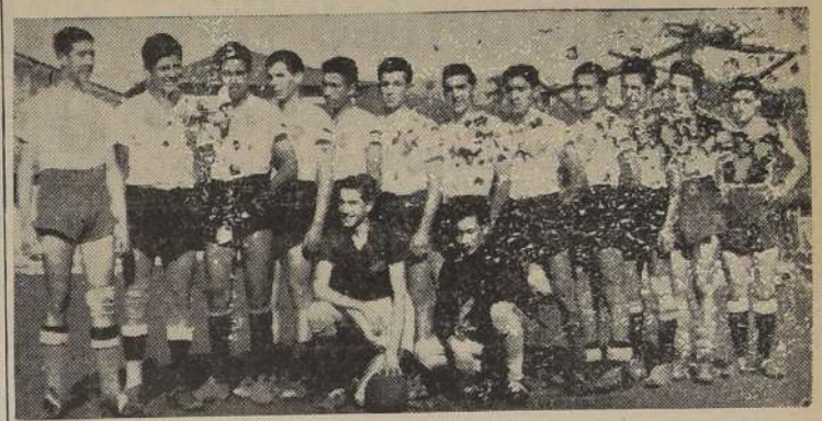
Cuadro juvenil de Colo-Colo, campeón de la Sección Cadetes. Los albos han ganado ya tres divisiones.

Con sus tres equipos, el Colo Colo se ha clasificado campeón de apertura de la Sección Cadetes en esta temporada. Primero con el de división especial, y ayer con sus equipos de Primera y Juvenil, al vencer por la cuenta mínima a Magallanes y Nacional Juventus, respectivamente.