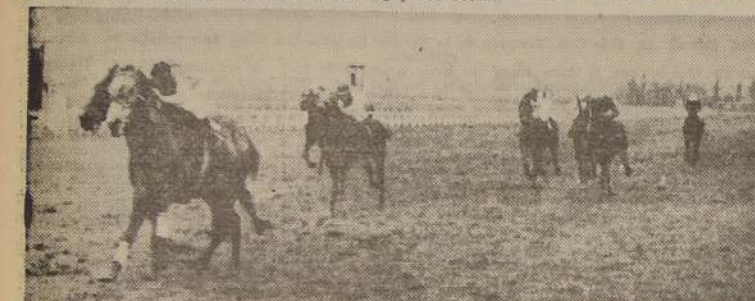
Marot, domina a Fred Astaire y Nieve en la carrera condicional