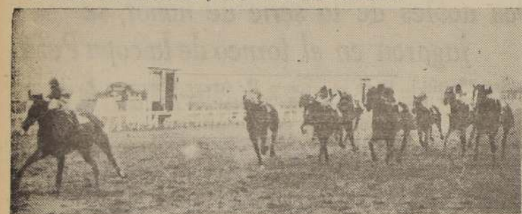
Alul, al galope delante de Beta y Simbad en la tercera carrera

Talquipén. De los otros Vanderbilt se clasificó segundo; Tercera remató tercera y finalmente Sirius no ocupó sitio en el marcador.