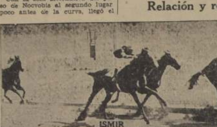
ISMIR BACHILLER ETHIOPIE

Relación y resultados generales de las distintas pruebas y noticias diversas