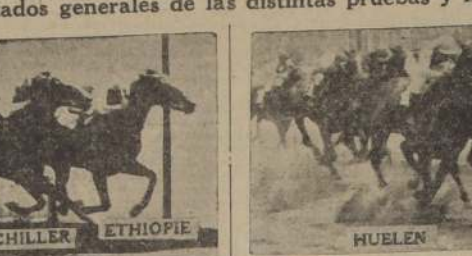
HUELEN FRESURA SANDIAL

Relación y resultados generales de las distintas pruebas y noticias diversas