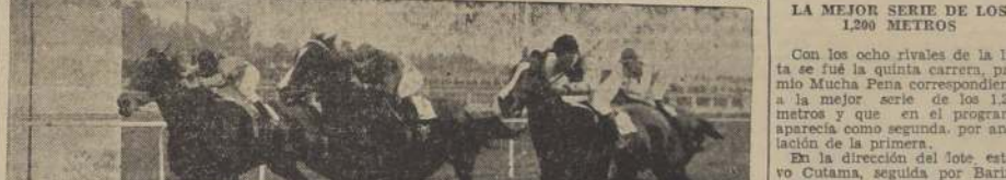
GUAELEMU POCHOLITA BELDAD

LA MEJOR SERIE DE LOS 1.200 METROS Con los ocho rivales de la lista se fue la quinta carrera, premio Mucha Pena correspondiente a la mejor serie de los 1.200 metros y que en el programa aparecía como segunda, por anulación de la primera.