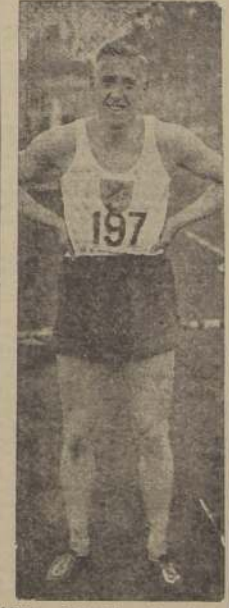
Atleta holandés Osendarp, campeón de Europa de los 100 y 200 metros planos, con 10 5/10 y 21 2/10, respectivamente. Los records mundiales de ambas pruebas continúan homologados para J. Owens, norteamericano, con 10 2/10 y 20 3/10.

notables. En Dortmund, Harbig corrió 400 metros llanos en 47", señalando un nuevo "record" europeo, y Hein lanzó el martillo a 57.20 metros. En Munich, Black obtuvo un registro casi igual en dicha especialidad: 57.22 metros, y en Osnabruck, días más tarde, el mismo Hein, no sólo superó su anterior "performance" de Dortmund, sino también el "record" mundial arrojando el martillo a 58.24 metros. En Heidelberg, B. Grulich, otro especialista del martillo, ejecutó un tiro de 55.81 metros, y en Wuppertal, Wolke lanzó la bala a 16.62 metros y Wolapek el disco a 49.96.