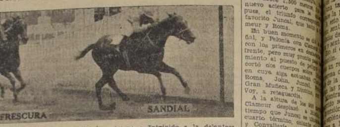
HUELEN FRESURA SANDIAL

Relación y resultados generales de las distintas pruebas y noticias diversas