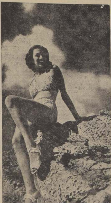
Alegre y hermosa esta artista italiana sonríe mientras toma el sol en las playas de San Remo, una de las playas más bellas de Italia.