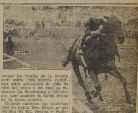
TERMINO AL PROGRAMA Y DE LA CUAL SE ELIMINARON KANABABA Y PALMISTO

Ordenado el movimiento, salió en punta Nibilito favorecido por los malos rezagados Millerand y Chatterbox, pero luego pasó a la punta Bar Inglés llevando a sus flancos a Millerand y Casablanca, cuyo jockey, advertido del tren falso frente a la milla, se posesionó del primer puesto vigilado por Millerand, Mercurial Bar Inglés y el favorito Marañón, quedando al fondo Kabu y Chirimojo.