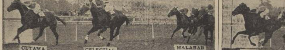
CUTAMA CELESTIAL MALABAR

Cuando partieron, lució sus colores en punta Pampero, caído en una línea con Huasilla, Perusa y No Creía, ésta por cuarta línea delante de Tango Bar, Enredada y Sendai, quedando último Epituro.