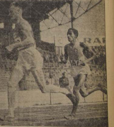
El finlandés Salminen, campeón mundial de los 10,000 metros con 30' 5 6/10", venciendo recientemente en Colombes, por el campeonato de Europa, en esta misma prueba, con 30' 52 4/10". Le sigue el minúsculo atleta italiano Bevacqua, que le entabló gran lucha al recordman, cayendo batido por sólo 4/5 de segundos.