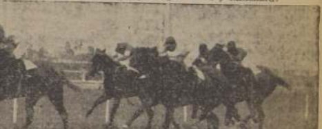
CASABLANCA LOGRO PONER A SUS RIVALES

La puntera empezó a tomar vuelo y cuando tomaron la recta final venía con no menos de 5 cuerpos de luz que Mercurial, primero, y Marañón, después, trasaron de descomponer instructivamente, debiendo contentarse con el tercer y segundo puestos, respectivamente, delante de Bar Inglés Kabu y Millerand.