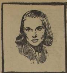
ANN TODD, es una de las protagonistas de "Agonía de amor" que va en segunda semana en el Central.