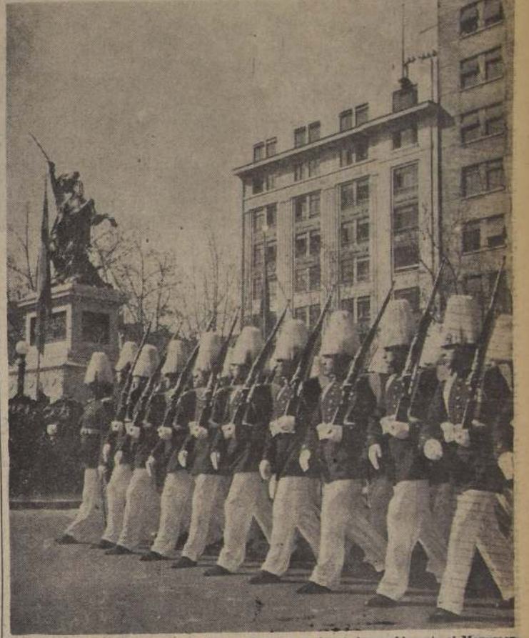
Los bizarros cadetes de la Escuela Militar desfilan en forma impecable ante el Monumento a don Bernardo O'Higgins, durante la brillante ceremonia en que el Ejército rindió homenaje al Creador de la República.