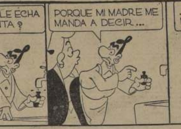
Por Lino Palacio