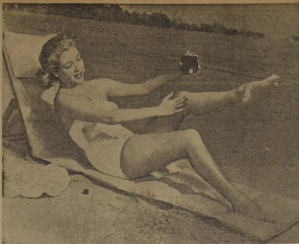
SE CUIDA LA NISA. - HOLLYWOOD, agosto 1951. - La hermosa Mónica Lewis, que ha actuado en tres películas y que es brillante estrella de la televisión, tiene un método propio para el cuidado de la piel en la playa californiana. Se fricciona con un preparado especial, inventado por ella, a base de limón, aceite vegetal y esencia de rosas.