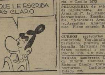
Por Lino Palacio

18.-EDUCACION. "ARMANDINI", únicas academias realmente especializadas en todo lo relacionado con la peluquería de señoras. Peluqueros, permanentes, tinturas, manicuras, pedicura, etc. Últimos adelantos. Sistema práctico en auténtico instituto de belleza. Nuestra experiencia de más de 14 años, garantiza el éxito de cada alumna. Clases todo el año. Profesorado muy especializado. Ambiente decorado. Enseñanza rápida, perfecta, para alumnas de provincias. Diplomas válidos en todo el país. Academias Profesionales del Peluquero Armandini. Chile-Argentina. Ahumada 131, 7.º piso, Oficina 114. Teléfono 63775. Casilla 4736. Santiago. 20-F-32