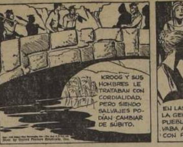
Por Lino Palacio