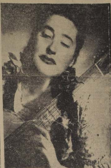
MARGOT LOYOLA ilustrará con canciones típicas de la tierra nuestra las viejas folklóricas que, desde mañana habrá en el Museo Histórico. Margot no sólo representa la belleza típica de "nuestra mujer", sino que sabe poner "intención, gracia y sal" en cuecas y tonadas.