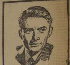
GREGORY PECK, tiene destacada actuación en "Agonía de amor", film de gran éxito en el Central.

Por lo pronto, aparecerá en una película infantil en el colegio de Sagrado Corazón, donde se educa.