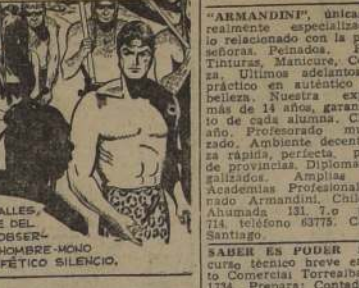
Por Lino Palacio