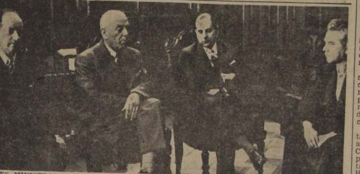
LOS MINISTROS Y UN EMPRESARIO.— Los Ministros, de Economía, señor Infante; del Interior, señor Quintana, y de Hacienda, señor Pico Cañas, con el presidente de los empresarios de micros, señor Palma, durante la reunión de ayer.

Autos federales de Santiago y a la Confederación Nacional de Dueños de 11.º El Gobierno prestará su decisión de acción a la importancia de las máquinas para el transporte colectivo, siempre que los empresarios particulares se organicen en una o más entidades que garanticen el cumplimiento de las obligaciones que derivan del servicio público que están llamadas a prestar y aseguren asimismo, el cumplimiento de las leyes sociales para con su personal de obreros y empleados.