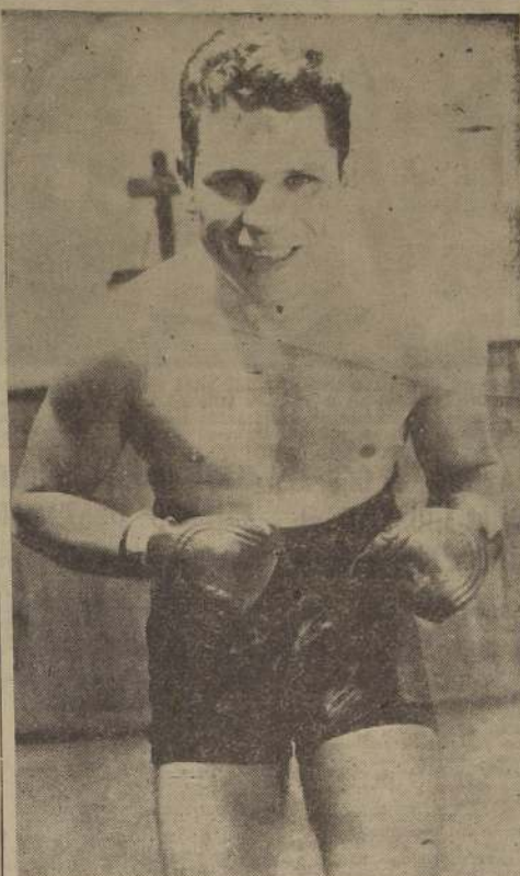
SE ABRE PASO EN EE. UU. — El púgil argentino José María Gatica está incluido entre los mejores boxeadores que aspiran un puesto de honor en el boxeo mundial.