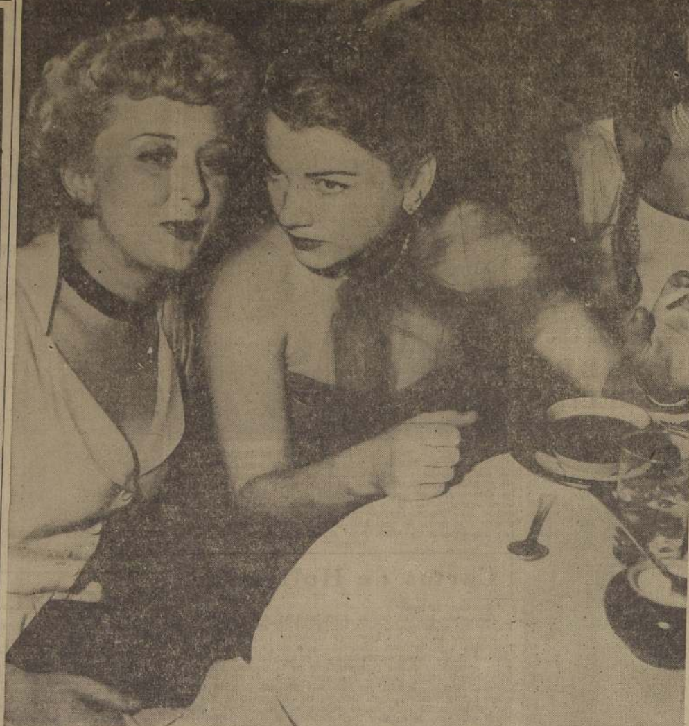
CELESTE HOLM CANTA EN PRIVADO. — Celeste Holm no sólo es una buena actriz, sino que, además, tiene la gracia de cantar y hasta de componer música. Aquí la vemos en el momento de cantar, muy en privado, para Anne Baxter, su última canción.

ALAMEDA (31254) — Rotativo: 13 horas: Todo el mundo lo ha visto. Que siga la boda, El último payador y Serial. ALCAZAR (30122) — Rotativo: 8 y noche: 22 horas: Cita. Humores. ALMAGRO (33425) — Rotativo: 15 horas: Los condenados no lloran y Sangre de campeón. AMERICA (32443) — Rotativo: 8 y noche: 22 horas: Cita. Humores. AUDITORIUM (34688) — Rotativo: 8 y noche: 22 horas: Cita. Humores. AVENIDA MATA (31455) — Rotativo: 8 y noche: 22 horas: Cita. Humores. BALMACEIDA (33768) — Rotativo: 8 y noche: 22 horas: Cita. Humores. BANDERA (30111) — Rotativo: 8 y noche: 22 horas: Cita. Humores. BAQUEDANO (33098) — Rotativo: 8 y noche: 22 horas: Cita. Humores.