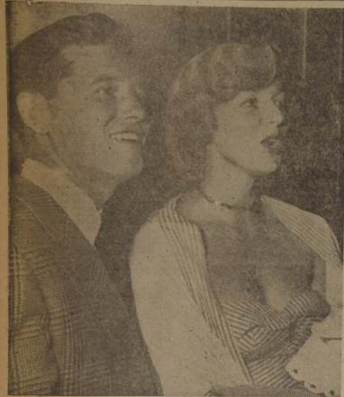
¿QUE OCURRIÓ EN EL ESCENARIO? —A jugar por la expresión de asombro que muestran Gordon Mac Rae y su atrevida esposa, algo muy raro debe haber ocurrido en el escenario. Esta pareja tiene en Hollywood un perro chileno, "Roto", que les fue obsequiado por marinos de nuestra flota mercante.