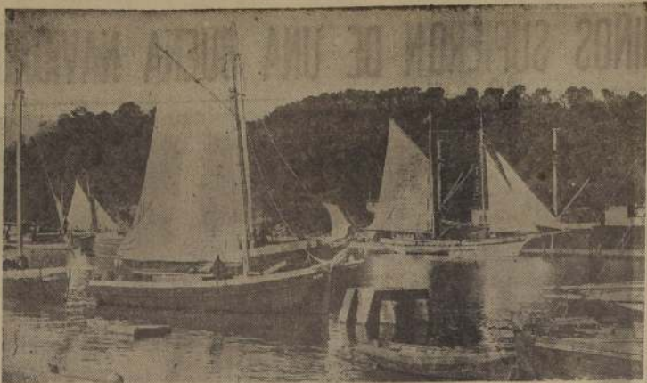
Angelmo, en Puerto Montt, es de nuevo una de las atracciones turísticas de la zona sur. Sus parajes de extraordinaria belleza, uno de los temas de los turistas.

—Se ha restablecido de su enfermedad el Procurador del Número 1, Longoche, señor Pedro Pablo Contreras.