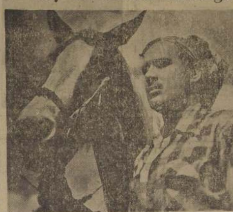
Esta escena pertenece al film "La barca de oro", donde actúa el cantante Pedro Infante.

Un nuevo estreno presentará hoy la distribuidora Pel. Mex en el cine Santiago.