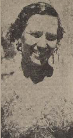
María Lenk, recordwoman mundial 100 metros estilo libre

GIA. SUD AMERICANA DE VAPORES A Nueva York e Intermedios: Salida Llegada M/N "IMPERIAL" . . . 12 Febrero 3. Marzo M/N "ACONCAGUA" . . . 26 Febrero 17. Marzo M/N "COPIAPO" . . . 19 Marzo 7 Abril Gia Sud-Americana de Vapores SANTIAGO, AGUSTINAS 1109 - TELEFONO 80239