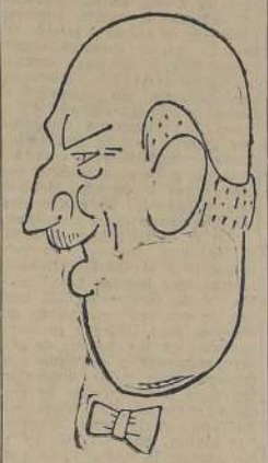
Pierre E. Flandin

Los acontecimientos de la semana se señalan con la caída de Bengasi, punto culminante de la campaña inglesa en la Cirenaica (oeste de Libia); la situación política franco-alemana, agravada por la inquietud del Eje frente a la preponderancia británica en el Mediterráneo y, por último, por la aprobación por la Cámara de Representantes de EE. UU. del proyecto de ayuda a las democracias, después de una semana de intensos debates, al cabo de la cual el proyecto 1776 triunfó por 260 votos contra 165, sometiendo a algunas enmiendas.