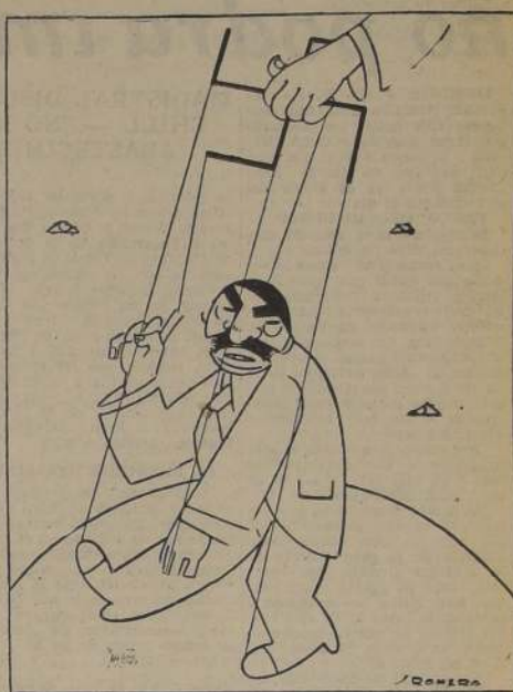
LAVAL. — Así entiendo yo la colaboración franco-alemana.