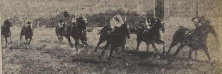
Lutecia precede a Azulino y Payaso en la serie principal de 1.500 metros

El puntero mantuvo su situación de privilegio hasta las galerías, en donde Virginia le dio casa y muy pronto lo dejó atrás, siguiendo al disco con su victoria asegurada, batiendo al hijo de Aretino por 1 cuerpo. El ter-