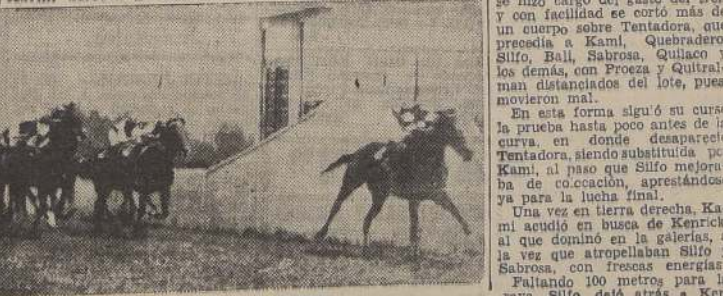
Ana de Austria aventaja a Naranjita y Pololita en la tercera carrera