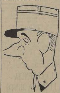
General de Gaulle

Observadores más sutiles, volviendo a Laval, creen que éste, lejos de pensar en entregar Francia entera a los alemanes, piensa buscar su colaboración para llegar a ocupar en el Eje el lugar de Italia, lo que no parece despojado de realidad.