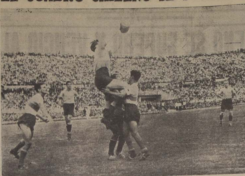
Faz, el tranquilo guardavallas uruguayo, intercepta un centro de Freire. La ofensiva de los ecuatorianos resultó absolutamente ineficaz. Los celestes jugaron a voluntad.