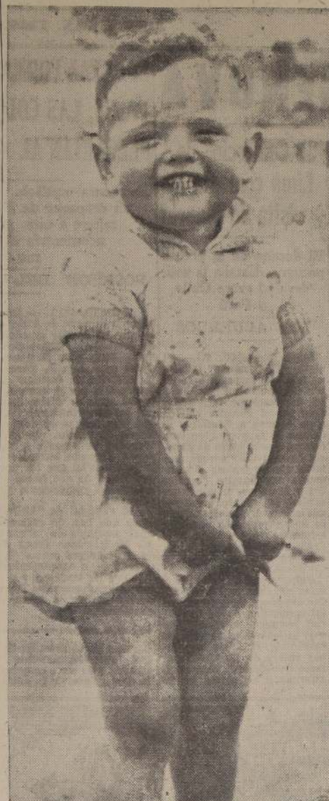
Un precioso veraneante en Las Playas de Cartagena