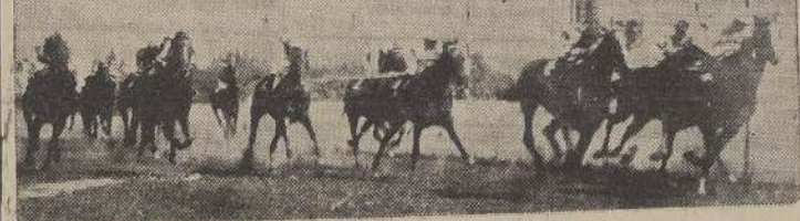
Kami derrota a Silfo y Kenrick en el premio Farsalia.

cada uno de los cuales es el alma argentina hecha canción