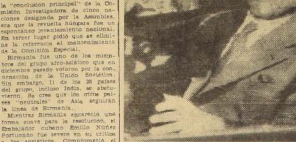
BELGRADO (Yugoslavia).—El Presidente Tito, de Yugoslavia (derecha) conversa sonriente con el jefe del Partido Comunista polaco, Wladimir Gomulka, el 10 de septiembre, en los momentos en que abandonan el aeropuerto de Belgrado, después de la llegada de Gomulka para una visita oficial. El 12 de septiembre los dos líderes continuaron sus conversaciones secretas en la capital yugoslava.