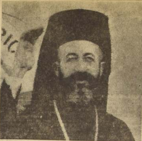
NUEVA YORK. — El Arzobispo Makarios, jefe religioso y nacional de la isla de Chipre, saluda a su llegada aquí en el transatlántico "Queen Frederika", el 12 de septiembre. El Arzobispo, en su cuarto viaje a Estados Unidos, dijo que esta visita la hacía con el propósito de "colaborar con el Gobierno griego y explicar al pueblo norteamericano la cuestión de Chipre". (Radiofoto UNITED PRESS).

De los 13 negros que se matricularon el lunes, 11 acudieron a las clases. Tres de los ocho ausentes fueron transferidos de nuevo a escuelas de negros.