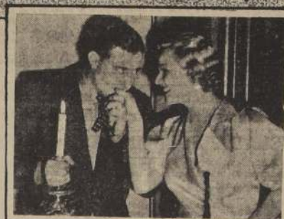
La noche suele ser mala consejera; en la soledad y el silencio las imágenes se reavivan y cobran forma, y cuando el señor Presidente está próximo a sucumbir, entra en escena Jean Pierre Gaudet, Ministro de Justicia de Francia, para salvar el prestigio de la magistratura francesa.