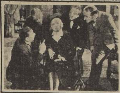
Si Catón el Censor hubiera conocido a Verotcha, en tal forma se habría escrito la historia de este probo varón...

Con la complicidad de la camarera y de los demás magistrados, que desean romper la línea de conducta inquebrantable del señor Presidente, Verotcha rápidamente instruida sobre la personalidad del probo señor Tricointe se instala en la alcoba de la Señora Presidenta.