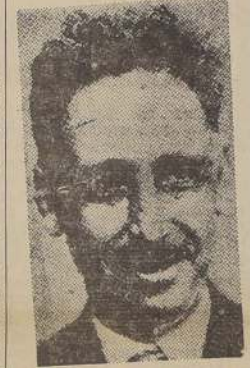
Luis Companys, Presidente de la Generalidad