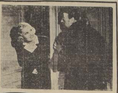
El anciano Presidente Tricointe, turbado por un perfume delicioso, distinto a cualquier otro que percibía en su hogar, seducido por los mimos de la artista, cedido al olor que sus ojos, envejecidos en el estudio de los áridos procesos, podían inspirar todavía una pasión, tiene un gesto de juventud y ofrece el lecho de la señora Presidenta a la artista Verotcha.