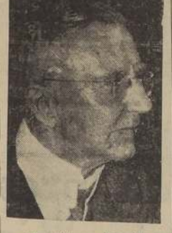
Dr. Hjalmar Schacht

Se estima que con esto ha terminado el predominio de los moderados en la dirección de las finanzas y economía del Reich. Funk es actualmente Ministro de Economía, cargo que conservará. Según parece, los últimos fracasos de Schacht determinaron su caída.