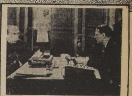
DE LO QUE PASO EN EL MINISTERIO El Ministro reconoce el hecho de que los últimos nombramientos han sido poco democráticos e inspirados por combinaciones de políticos; y, decide premiar los méritos que adornan al Presidente del Tribunal de Gracia.