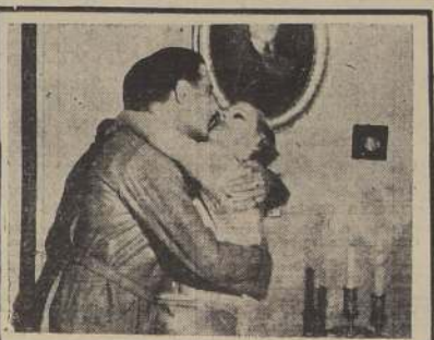
DE COMO UN MINISTRO VINO, VIO Y VENCIO La República le elevó al Ministerio, porque era galante como el Rey Sol y audaz como un Don Juan; condiciones estas que son triunfos en la burja de la vida. Inquietantes juegos de luces, coquetería expresiva, esa comprensión de los deberes que debe tener la castellana para con el jugador que acoge en su morada, y el hecho de sentirse Verotcha en el rol de Presidenta, o sea, ser quien no se es, determinaron esta segunda edición del abrazo de Munich y ¡Viva la France!