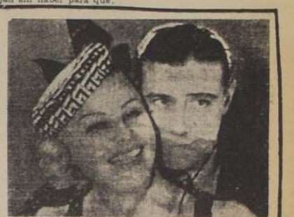
ADELANTE LOS QUE ESPERAN Este alegre vodevil, calificado con justicia como la sonrisa galante de París, está interpretado por Elvira Popesco y Henry Garat; y por su gracia y picardía es una inyección de vida para los que asistan a su premiere el lunes próximo en el Teatro Baquedano.