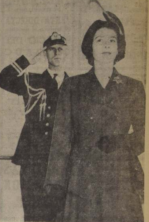
VALETA, Malta.— El papel del Duque de Edimburgo como esposo de la princesa heredera del trono de Inglaterra, Elizabeth, es simbolizado en esta fotografía tomada a bordo del crucero norteamericano "Des Moines", cuando ambos le hicieron una visita oficial. El duque y la princesa escuchan el Himno Real Británico.

Después de haber el representante chino usará del veto para impedir su propia expulsión. Es una cuestión de representación, dijo; "no es una cuestión de simple procedimiento, sino una cuestión política de la mayor importancia".