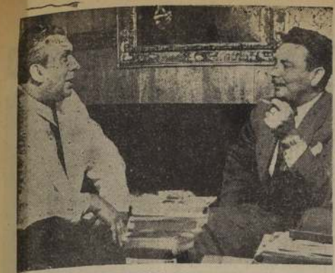
EMBajador DE GUATEMALA EN "LA NACION".