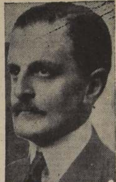
Carlos Saavedra Lamas

"Todos los países amantes de la paz deben mantenerse junto al pueblo argentino en estas horas de crisis"