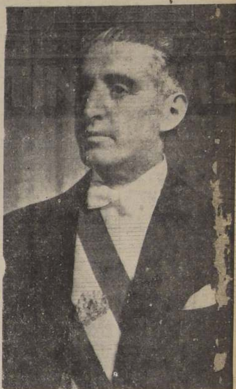
El Excmo. señor Juan Antonio Ríos, quien parte hoy en misión de confraternidad hacia las naciones del Continente americano.