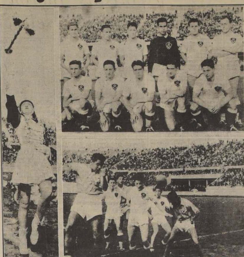
SE LUCIO LA "BARRA" DE LA ESCUELA DE AVIACION. — En la reunión verificada ayer en la tarde en el Estadio Nacional, tuvo un comportamiento muy lucido la "barra" de la Escuela de Aviación. En el mosaico vemos en primer término al simpático "tambor mayor" de los aviadores, una hermosa dama que lanza al aire su guirripa con bastante gallardía y corrección. Al centro, arriba, el conjunto de la Escuela Naval que ganó por 4 a 0. Abajo, el goal marcado por el insider Chelliew, con golpe de cabeza. A la derecha, arriba, parte de la "barra" de la Escuela de Aviación con sus vistosos uniformes. Abajo, los cadetes de la Escuela Naval, entonan en el centro de la cancha el himno oficial del establecimiento.

En la cuarta etapa, los blancos (E. Naval) presionaron con mayor insistencia hasta dar al score su estructura definitiva, en suma de 4-0.