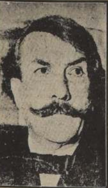
Dr. Alfredo L. Palacios