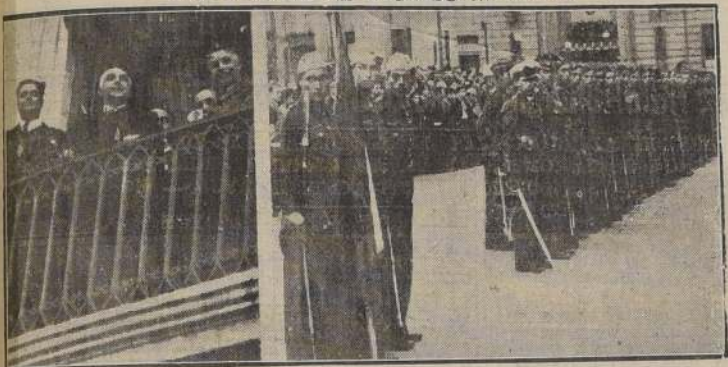
El Excmo. señor Duhalde presencia el desfile de la Brigada, desde los balcones de la Moneda.

Una lucida presentación ante el Palacio de la Moneda realizó ayer la Brigada Aérea "Los Condors" de Iquique, como despedida después de haber realizado una visita a esta capital. Esta organización juvenil, que fue creada por decreto del ex Presidente de la República Excmo. señor Pedro Aguirre Cerda, partirá hoy de regreso a Iquique.