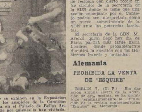
"La Cueva", grupo de muñecos que se exhiben en la Exposición de Arte Popular Chileno, que, bajo los auspicios de la Comisión de Cooperación Intelectual, funciona en el Palacio de Bellas Artes, y que ha sido justamente elogiado por quienes la han visitado.