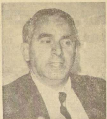
MINISTRO WILLIAM THAYER.