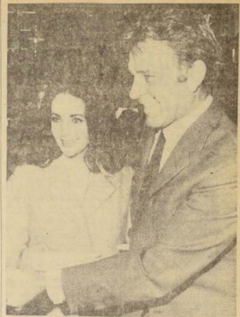
Liz Taylor, acompañada de Richard Burton. Ambos artistas se encuentran filmando "La Fierecilla Domada", film basado en la comedia homónima de Shakespeare.

PERSONAJES HERMÉTICOS. — Algunos de los personajes de Pinter no hablan nunca o no se escuchan totalmente. Pero es la voluntad de ser